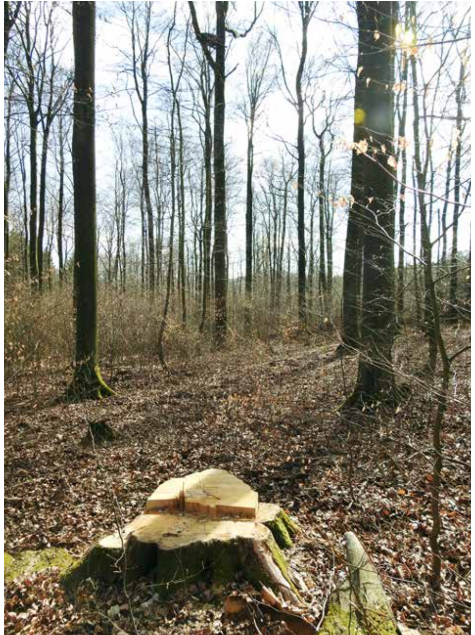
Abb. 5: Leider nach wie vor ein großes Problem sind Störungen im direkten Horstbereich, wie dieses Beispiel aus dem Jahr 2020 im Gebiet des Biosphärenreservats und Vogelschutzgebiets „Hessische Rhön“ (Hessisches TOP-5-Gebiet für den Schwarzstorch) zeigt: Baumfällungen Ende März in unmittelbarer Nähe zu einem besetzten Schwarzstorchnest auf einer künstlichen Plattform (oberer Bildrand in der Bildmitte), das anschließend verlassen wurde.

Der Schwarzstorch ist in allen relevanten Naturschutzrichtlinien und Konventionen aufgeführt. Er ist daher u. a. als Anhang-I-Art der Vogelschutzrichtlinie nach den Begriffsbestimmungen des Bundesnaturschutzgesetzes als streng geschützte Art zu behandeln. Der Status des Schwarzstorchs gemäß Roter Liste