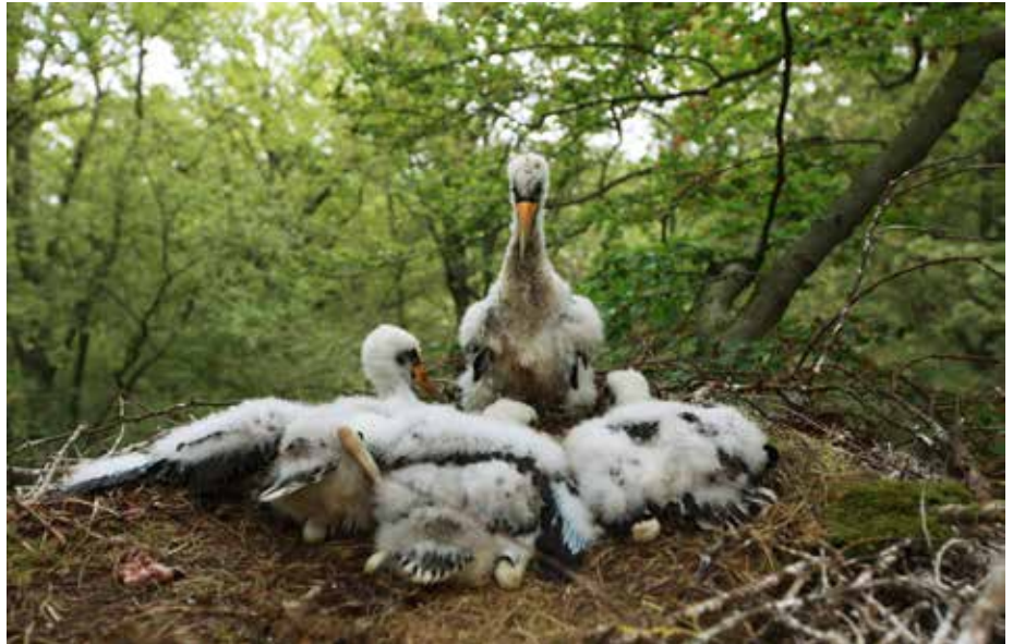
Abb. 4: Schwarzstorchhorst

ein angestammtes Nest über viele Jahre hinweg, Traditionsnester können sogar über Jahrzehnte genutzt werden. Aufgrund von Störungen beträgt die durchschnittliche Nutzungsdauer von Schwarzstorchhorsten in Hessen zurzeit allerdings kaum mehr als zwei Jahre. Die guten Brutergebnisse einzelner traditioneller Brutpaare belegen aber, dass lokal gute Habitatbedingungen durchaus bessere Brutergebnisse zulassen würden (Abb. 4). In ihrer Summe tragen alle diese Einflüsse dazu bei, dass sich die Anzahl der Revier- und Brutpaare des Schwarzstorchs in Hessen offenbar dauerhaft nicht über eine sehr niedrige Schwelle erheben kann.