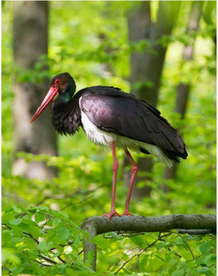
Abb. 2: Adulter Schwarzstorch

Fakt ist, dass der Schwarzstorchbestand in Hessen nach wie vor starken äußeren Einflüssen ausgesetzt ist. Nicht unwesentlich dürften Verluste auf dem Zugweg nach und von Afrika sowie in den Überwinterungsgebieten sein (vgl. GELPKE et al. 2018). Haben es die Störche schließlich nach Hessen geschafft, gibt es aber auch hier mannigfaltige Widrigkeiten zu bestehen, seien es direkte oder indirekte Störungen im Bruthabitat, Scheuchwirkungen oder letale Einwirkungen auf Einzelindividuen (LÖSEKRUG et al. 2016). Insbesondere sind die Bruterfolge von Schwarzstörchen mancherorts sehr gering, da entweder nur wenige Jungvögel erbrütet werden oder die Bruten aufgrund von menschlichen Störungen vorzeitig abgebrochen werden und gar keine Jungvögel ausfliegen. Ein wesentliches Problem scheinen störungsbedingte Brutplatzwechsel zu sein, was im Regelfall mit deutlichen Einbußen bei der Reproduktion einhergeht. Normalerweise nutzt der Schwarzstorch