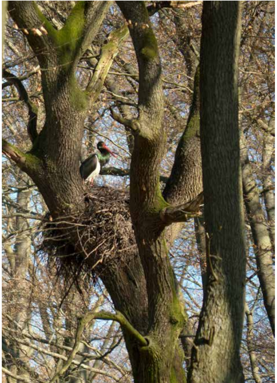
Abb. 1: Schwarzstorch auf seinem Horst

Nachdem im Jahr 1972 nach langer Vakanz wieder der erste Brutnachweis für Hessen erbracht worden war, dauerte es weitere zehn Jahre, bis erneut eine weitere Brut festgestellt wurde. Seitdem nahm der Bestand dieser Art aber kontinuierlich bis etwa 1995/1996 zu. Um die Jahrtausendwende wurden in Summe