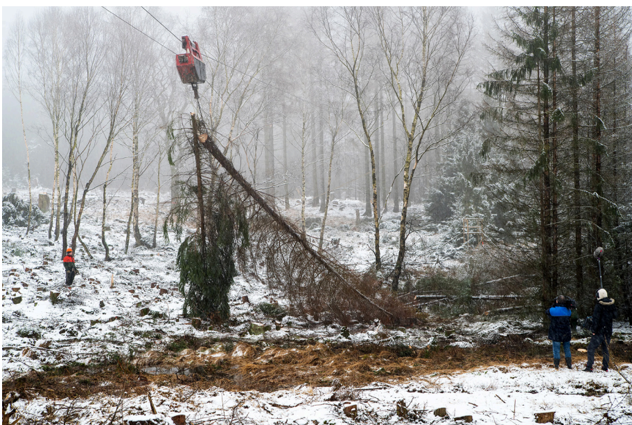
Abb. 4: Die Entnahme der Fichten mit der Seilkrananlage im Februar und März 2020 im Federbruch wurde teilweise von einem Kamerteam begleitet.

Als infolge der Borkenkäferkalamitäten nach den Trockenjahren 2018 und 2019 im Federbruch Teile der Fichtenbestände abzustarben begannen, galt es zügig zu handeln. Andernfalls drohte ein flächenhaftes Absterben und nachfolgendes Zusammenbrechen der Fichten. Die Holzmassen hätten dann den Moorboden oberflächlich bedeckt und es wäre zu einer Stickstofffreisetzung gekommen, in deren Folge sich mooruntypische Pflanzenarten stark ausgebreitet hätten. Für die bodenschonende Entnahme der Fichten war eine Seilkrananlage notwendig. Eine kostendeckende Umsetzung der Maßnahme war daher nicht denkbar. In dieser Situation gelang im Rahmen einer beispielgebenden Zusammenarbeit zwischen dem Forstamt Reinhardshagen