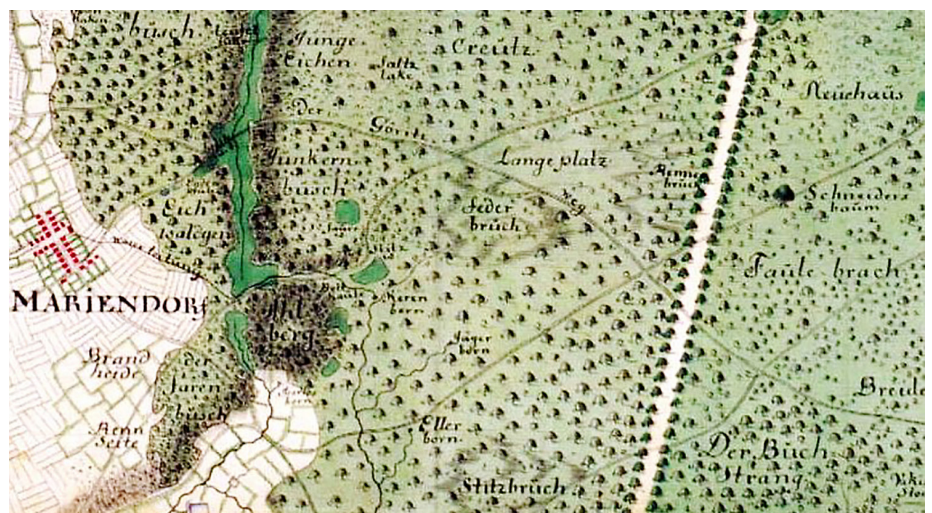
Abb. 2: Der Federbruch auf der Rüstmeister-Karte von 1724 (Bildmitte)

Das Federbruch-Quellmoor und ein Teil der angrenzenden Hangmoor-Bereiche