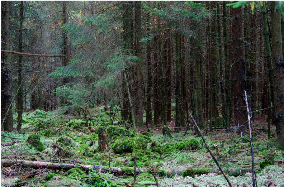
Abb. 3: Bis Anfang 2020 war das Federbruch-Quellmoor von einem dunklen, krautschichtarmen Fichtenbestand bewachsen.

waren bis Anfang 2020 von einem dichten, krautschichtarmen Fichtenbestand geprägt (Abb. 3). Nur an lichten Stellen hatten sich nasse Pfeifengras-Stadien mit Torfmoosen erhalten. So ist es wenig verwunderlich, dass das Gebiet lange Zeit ein Schattendasein führte und dass seine Bedeutung erst 2011 im Rahmen eines Moorgutachtens (KÜCHLER 2011) sowie 2017 bei der Entnahme eines über drei Meter langen Bohrkerns für eine pollen-