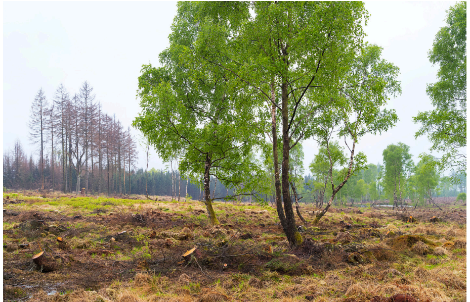
Abb. 5: Das Federbruch-Quellmoor nach der Fichten-Entnahme im Frühjahr 2020

Das Beispiel des Federbruchs zeigt, dass es noch immer gelingen kann, naturschutzfachlich herausragende Waldmoore wiederzuentdecken und gemeinsam mit verschiedenen Akteuren daran zu arbeiten, die Fehler der Vergangenheit – soweit möglich – zu korrigieren. Hierfür ist es notwendig, dass den Waldmooren