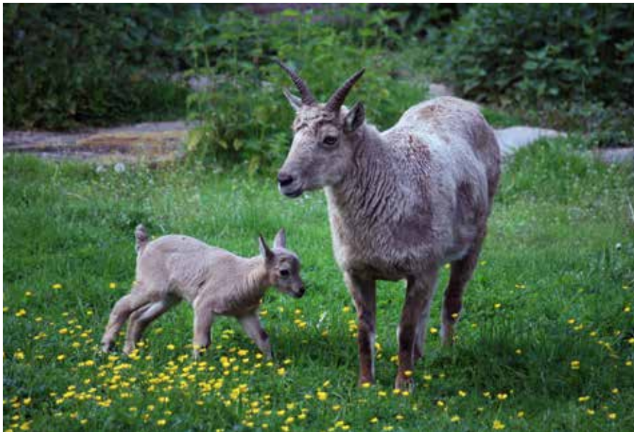
Abb. 3: Steinbock „Elsa“ mit dem Jungtier „Jitka“ im Mai 2017

teren Weibchen, „Anna“ und „Barbara“, aus dem Tierpark Chemnitz und dem Zoo Dresden zur Blutauffrischung bei uns ein. In der Anlage leben nun neun Steinböcke – ein Bock, fünf Geißen und drei Junge – und ab Mai werden vermutlich weitere Kitze geboren. Mit etwas Glück können Tierparkbesucher dann hautnah erleben, wie die Jungen herumhüpfen und meckernd nach ihrer Mutter rufen.