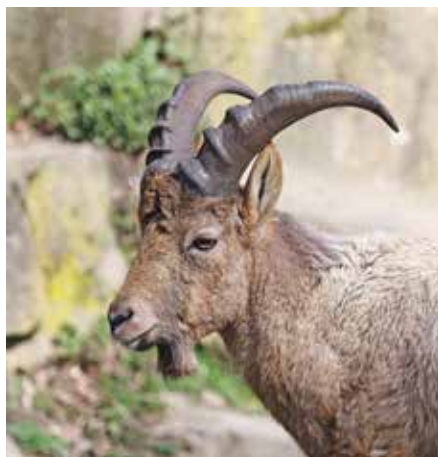
Abb. 4: Zuchtbock „Elbrus“ im März 2020