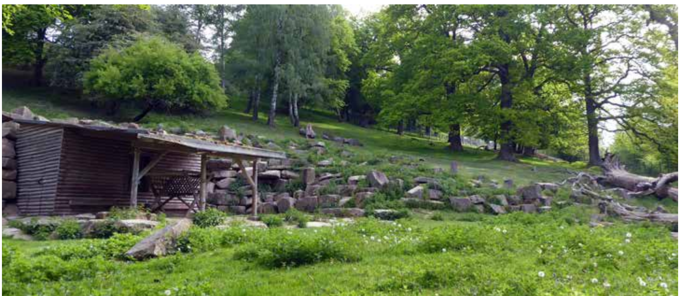
Abb. 1: Steinbock-Anlage im Tierpark Sababurg

Im Großen Kaukasus leben Kuban-Ture in Höhenlagen von 800 m bis 4.200 m