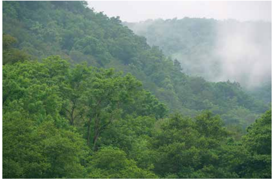
Abb. 1: Im Klimawandel bedroht: Buchenwälder im Kammerforst. Trotz Eignung wurde die südliche Hälfte bisher noch nicht geschützt.

Die Dürresommer 2018 und 2019 haben deutlich vor Augen geführt, was der Klimawandel für unsere Wälder bedeuten kann. In Hessen gab es dramatische Baumschäden auf etwa 23.000 Hektar Waldfläche. Überwiegend betroffen war die Fichte, die sich in Hessen als standortfremde Baumart nicht mehr unter den neuen Klimabedingungen behaupten kann. Aber auch viele heimische Laubbäume litten unter der Trockenheit. Selbst bei einer moderaten Klimaerwärmung droht in Deutschland der Verlust von über 15 % der Tier- und Pflanzenarten (HLNUG 2019).