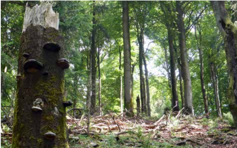
Abb. 4: Wälder im montanen Bereich (450–800 m ü. NN) wie hier auf den Taunushöhen fehlen noch in der hessischen Naturwald-Kulisse.

ten Waldgebiete ausgewählt. Uralte und artenreiche Eichen sind eine große Seltenheit in unseren Wäldern. Im Wirtschaftswald werden Eichen bereits im Alter von etwa 180 Jahren (Zielstärke 70 cm) gefällt. Eine Erfassung der Laubholzbestände der Alters- und Zerfallsphase des Landesbetriebs HessenForst für die Kernflächen ergab überhaupt nur 65 Hektar Eichenbestände über 240 Jahre in ganz Hessen. Dabei entwickeln sich erst in diesen Beständen wertvolle Strukturen wie stehendes Totholz. In Naturwäldern könnten Eichen eine Chance