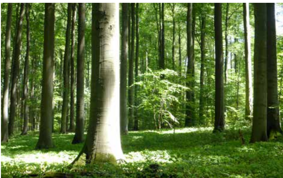
Abb. 5: Ein kleines, seit 32 Jahren geschütztes Naturwaldreservat (21 ha) zeigt, was für prächtige Buchenwälder im 285 ha großen Oppershofer Wald entstehen könnten, wenn auf die Holznutzung verzichtet würde.

erhalten, ein Alter von 500 Jahren oder mehr zu erreichen (HARTHUN 2017c). Ihre Konkurrenzkraft zur Buche könnte im Klimawandel steigen: Prognosen sehen die Eiche künftig im Vorteil gegenüber der Buche („Die Eiche könnte eine Gewinnerin des Klimawandels sein“, C. AMMER in der FAZ vom 26.9.2019). Die Dürresommer 2018 und 2019 zeigten bereits, dass viele Buchen unter starken Eichen vertrockneten. Sorge um Flächen für die Neubegründung von Eichenwäldern braucht man nicht mehr zu haben: Sie sollte auf den in den Dürresommern