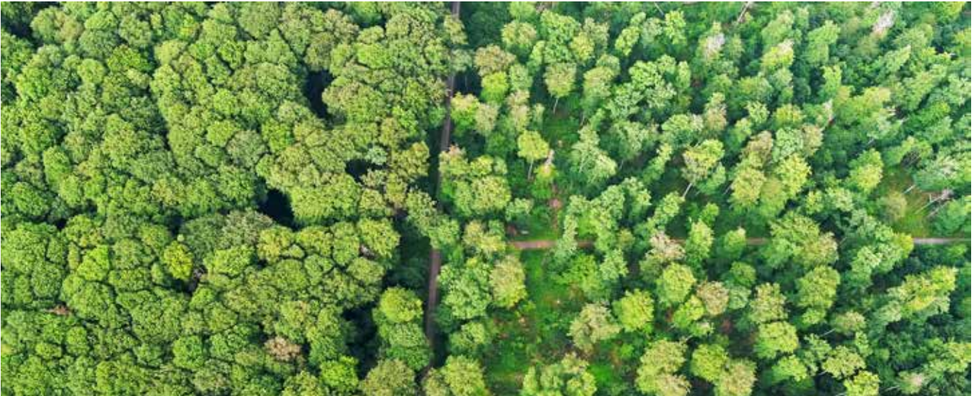
Abb. 6: Die Buche ist selbst im kollinen Bereich (hier 240 m ü. NN) trotz Dürresommer stabiler als oft prophezeit: Im Naturwaldreservat „Waldgebiet östlich Oppershofen“ (21 ha, links) schützt das nach 32 Jahren forstlichen Nutzungsverzichts geschlossene Kronendach den 140- bis 160-jährigen Wald besser gegen Austrocknung als im angrenzenden aufgelichteten Wirtschaftswald (rechts). Im September 2020 zeigten sich im bewirtschafteten Wald deutlich mehr Baumschäden als im Naturwald. Der Holzvorrat liegt im NWR inzwischen bei 733 Festmetern pro Hektar, im Wirtschaftswald bei 363 Festmetern.