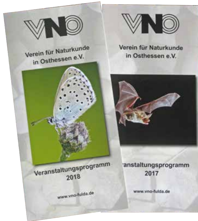
Abb. 3: Das jährliche Veranstaltungsprogramm mit botanischen, geologischen, entomologischen und ornithologischen Exkursionen wird in Form eines Flyers herausgegeben. Zudem wird es ins Programm der VHS der Stadt Fulda und des ortsansässigen Umweltzentrums mit aufgenommen.

und Berufsbildung, des Umweltschutzes, des Naturschutzes und der Landschaftspflege. Der Verein stellt sich dafür die Aufgabe, im osthessischen Landschaftsraum die gesamte Naturkunde zu pflegen, indem er die hier auf verschiedensten Gebieten wissenschaftlich tätigen Personen und Gruppen miteinander in Kontakt bringt und sie veranlasst, ihre an vielen einzelnen Orten gemachten Beobachtungen und Forschungsergebnisse einer breiteren Öffentlichkeit – insbesondere allen naturkundlich Interessierten – zugänglich zu machen. Auf diese Weise sollen die Kenntnisse über die Natur Osthessens vertieft und laufend ergänzt werden.“