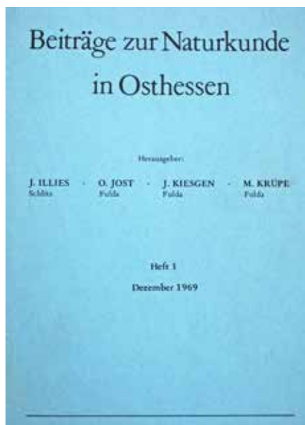
Abb. 2: Das erste Heft der Reihe „Beiträge zur Naturkunde in Osthessen“

Der in Krüpes Schreiben formulierte Auftrag wurde auch in der ersten Satzung des Vereins für Naturkunde 1970 festgehalten. Danach hat der Verein die Aufgabe, dass die „ Kenntnisse über die Natur der Osthessischen Heimat vertieft und laufend erweitert werden und Beobachtungen und Forschungsergebnisse einer breiteren Öffentlichkeit zugänglich “ gemacht werden sollen. Obwohl im Laufe von 50 Jahren einige Änderungen (1980, 1984, 1986) und Neufassungen (1993, 2004, 2016) des Satzungstexts vorgenommen wurden, haben sich die grundlegenden Zielsetzungen des Vereins nicht geändert; nur seine Struktur erfuhr einige geringfügige Abwandlungen. So heißt es in der aktuellen Satzung von 2016: „ Zweck des Vereins ist die Förderung von Wissenschaft und Forschung, der Volks-