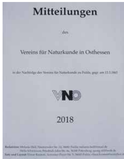
Abb. 4: Die Berichte des Vorstands, Kasenswarts, Schriftführers, der Kustoden und Arbeitskreise gehen den Vereinsmitgliedern seit 2007 in Form der „Mitteilungen des VNO“ zu. Zudem werden hier auch immer wieder kürzere Abhandlungen zu aktuellen naturkundlichen Themen aus der Region und ein Pressespiegel über Vereinsaktivitäten veröffentlicht.

Zweifellos sind das Veranstaltungsprogramm (Abb. 3) und die wissenschaftlichen Publikationen wichtige Säulen des Vereins für Naturkunde. Aber auch die mittlerweile etablierten „Mitteilungen“ als vereinsinternes Informationsblatt (Abb. 4) sowie die zum Teil regen Aktivitäten der Arbeitskreise (Astronomie, Botanik, Entomologie, Geologie, Ornithologie) und die Durchführung arbeitskreisübergreifender Projekte müssen als weitere wichtige Standbeine des Vereins angesehen werden. Darüber hinaus werden auf den jährlich stattfindenden Wissenschaftlichen Jahrestagungen den Mitgliedern und einer interessierten Öffentlichkeit Ergebnisse von Untersuchungen über die regionale Flora, Fauna, Geologie und den Sternenhimmel vorgestellt. Alle diese Aktivitäten basieren auf einem großen Engagement von Seiten der Mitglieder, die sich der Förderung der Naturkunde, der Naturwissenschaften und des Naturschutzes verpflichtet fühlen.