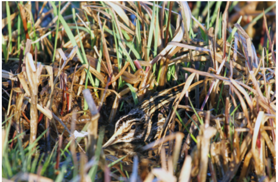
Abb. 1: Zwergschnepfe

Bisher ist nicht bekannt, wie sich die Alters- und Geschlechterverteilung der in