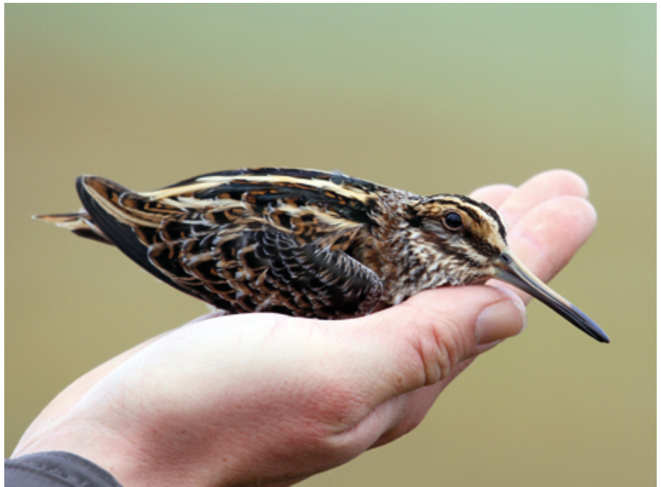
Abb. 4: Zwergschnepfe nach der Beringung