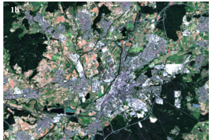
Abb. 1a – d: Aufnahme des Sentinel-2-Satelliten der Stadt Gießen und Umgebung in Hessen am 29.6.2019. (Quelle Sentinel-Aufnahmen: German Aerospace Center (DLR) (2019): Sentinel-2 MSI – Level 2A (MAJA Tiles) – Germany. https://doi.org/10.15489/ifczsszkcp63 )

1a: Lage des Ausschnitts der Aufnahme des Sentinel-2-Satelliten in Hessen rot umrandet dargestellt (Datengrundlage: HLNUG, Kartenhintergrund: HVBG)