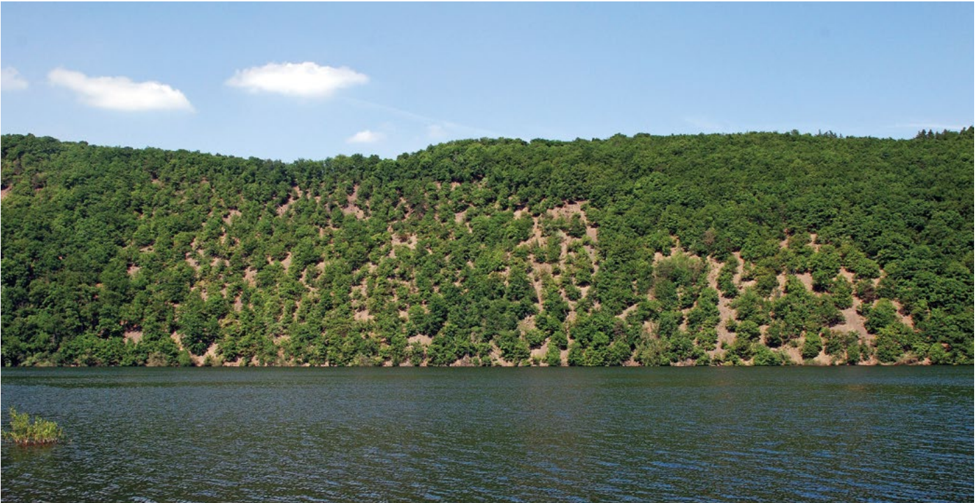
Abb. 1: Färberginster-Traubeneichenwald an der Kahlen Hardt