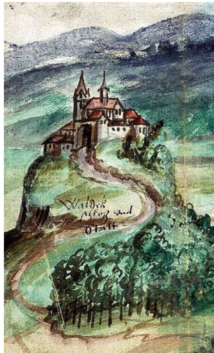
Abb. 5: Ansicht des größtenteils entwaldeten Schlossbergs Waldeck 1566

Betrachten wir nun einmal die Hangwälder auf der Nordseite des Edersees im