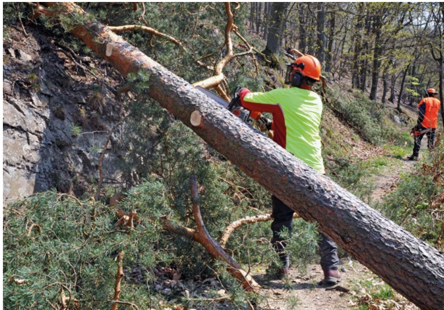
Abb. 3: Auszug von Kiefern im April 2011 aus dem Hainbuchen-Hangwald am Katzenstein

lung der Hangwälder am Edersee für das betreuende Forstamt Vöhl hatten.