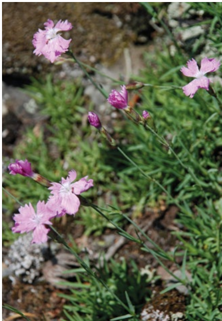
Abb. 2: Pfingstnelke ( Dianthus gratianopolitanus ) am Stiegberg in der Gemarkung Asel