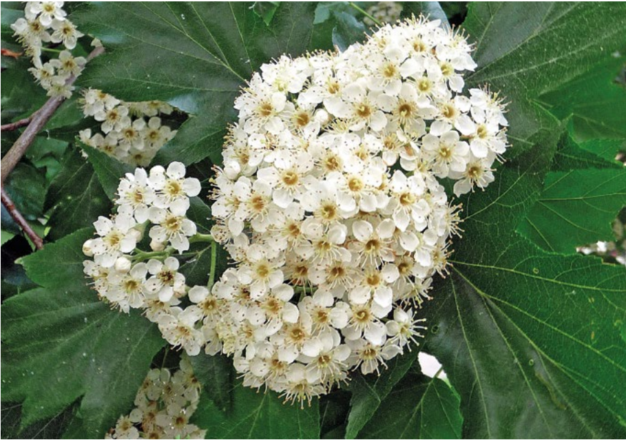
Abb. 4: Elsbeerenblüte

nördlichen Teil des Naturschutzgebiets Kahle Hardt entnommen. Dieser hatte bereits einen fast geschlossenen Kronenschirm über den mattwüchsigen Eichen ausgebildet.