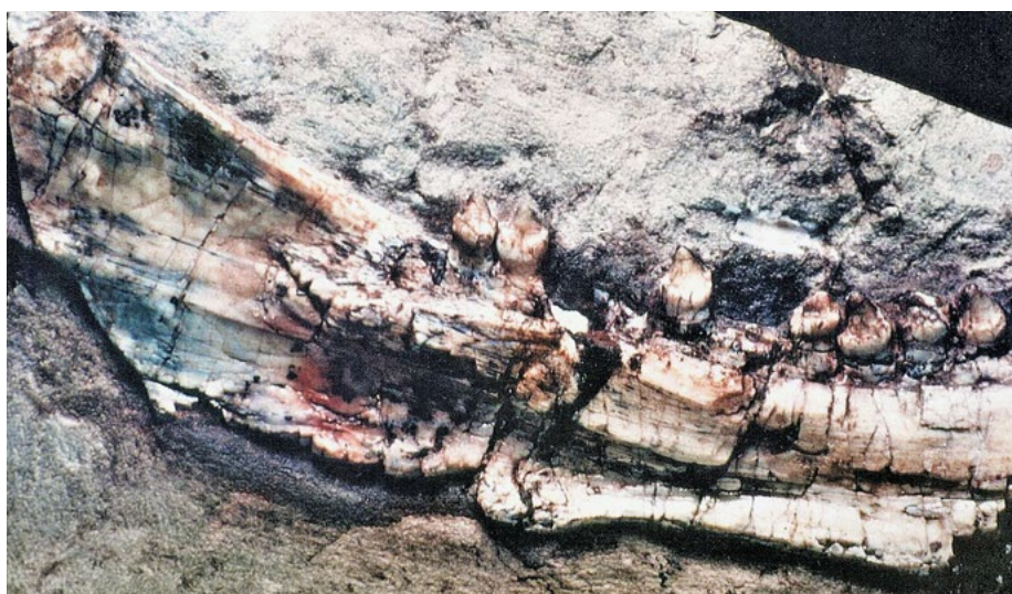
Abb. 2: Unterkiefer-Fragment mit gut erhaltener Bezahnung