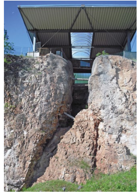
Abb. 3: Zustand der Fundstätte „Korbacher Spalte“ in den Jahren 1994, 1997 und 2010.

konzept“ an. Die erste Forschungsgrabung in der Spalte fand daraufhin im Juli 1991 unter der Leitung von Dr. Eberhard Frey (Staatliches Museum für Naturkunde Karlsruhe) sowie Prof. Dr. Hans-Dieter Sues (Smithsonian Institution/National Museum of Natural History, Washington/USA) mit technischer Unterstützung von Wolfgang Munk (Karlsruhe) sowie des örtlichen Spezialisten für Zechstein-Fossilien, Hartmut Kaufmann (Burgwald), statt. Finanziell unterstützt wurde die Grabung wie meist üblich durch Einwerben von Drittmitteln, in diesem Fall von der National Geographic Society (Washington).