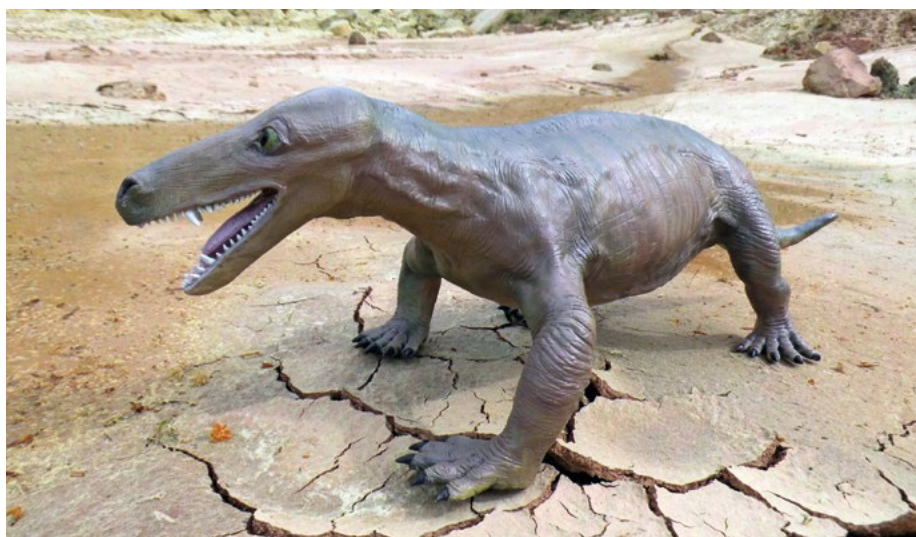
Abb. 1: Modell des „Hundezähners“ Procynosuchus.

Die Fossilienfundstätte „Korbacher Spalte“ ist neben der UNESCO-Welterbestätte „Grube Messel“ bei Darmstadt das bedeutendste paläontologische Bodendenkmal Hessens. Während die Funde in Messel unter anderem die Phase der Entfaltung der Säugetiere im frühen Tertiär-Zeitalter (ca. 50 Mio. Jahre vor heute) nach dem Aussterben der Dinosaurier dokumentieren, markieren die um rund 200 Mio. Jahre älteren Funde in Korbach die evolutive Frühphase der Säugetier-Entwicklung im ausgehenden Permzeitalter. Aufsehen erregte insbesondere der Fund eines Unterkiefer-Fragments der zur Unterordnung der Cynodontier („Hundezähner“) zählenden Gattung Procynosuchus (Abb. 1, 2), die zuvor weltweit nur in südafrikanischen Fundstätten nachgewiesen wurde. Aus der Gruppe der Cynodontier entwickelten sich im Verlauf der Trias die Säugetiere. Gemessen an der Bedeutung der „Korbacher Spalte“ hielten sich die Anstrengungen zur Sicherung der Fundstätte zunächst in einem eher restriktiven Rahmen. So verzögerte sich jahrelang sowohl der Ankauf als auch die bergbautechnische Sicherung der Fundstelle aufgrund fehlender Geldmittel. Heute ist lediglich ein Bruchteil der fossilhaltigen Spalten-Füllung an exponierter Stelle sichtbar geschützt.