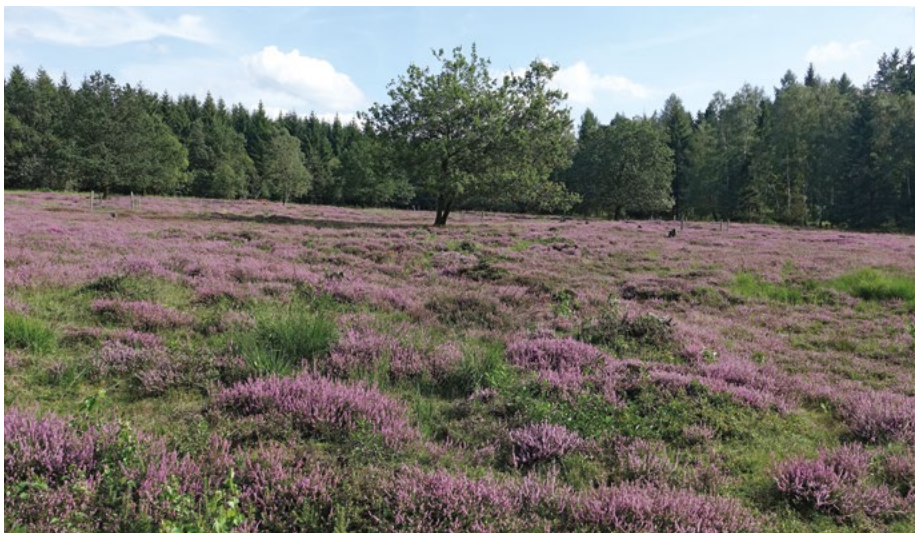
Abb. 3: Heidefläche in gutem Zustand im FFH-Gebiet Hirschberg und Tiefenbachwiesen bei Rommerode