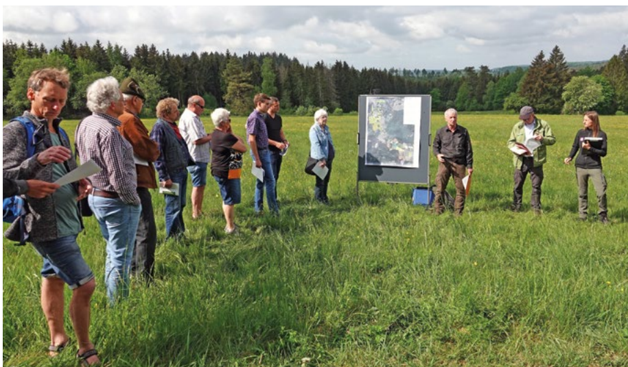
Abb. 4: Gutachter, Behördenvertreterinnen, Bewirtschafter und ehrenamtliche Naturschützerinnen mit Corona-gerechtem Abstand bei der GK des FFH-Gebietes Hirschberg und Tiefenbachwiesen

25 Teilnehmer unterschreitet, sind lebhaft und fruchtbare Diskussionen eher Regel als Ausnahme. Dies ist so gewollt und dem Schutzgebietsmanagement zuträglich. Um die Gesprächsrunden überschaubar und effizient zu halten, findet bei großen FFH-Gebieten oft eine regionale Teilung der Gebiete und damit auch der GK statt.