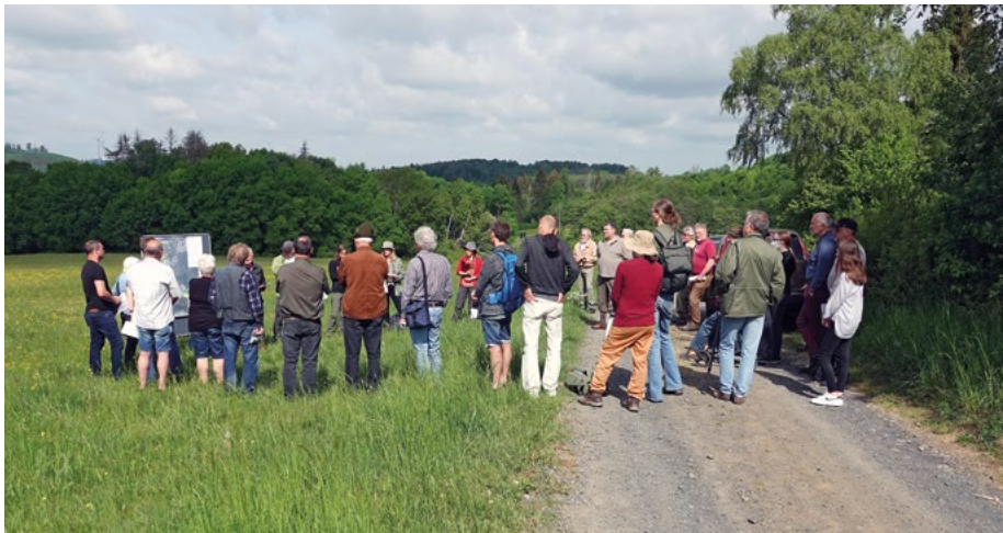
Abb. 2: Outdoor-GK im FFH-Gebiet Hirschberg und Tiefenbachwiesen bei Rommerode im Werra-Meißner-Kreis mit zahlreichen Teilnehmerinnen und Teilnehmern