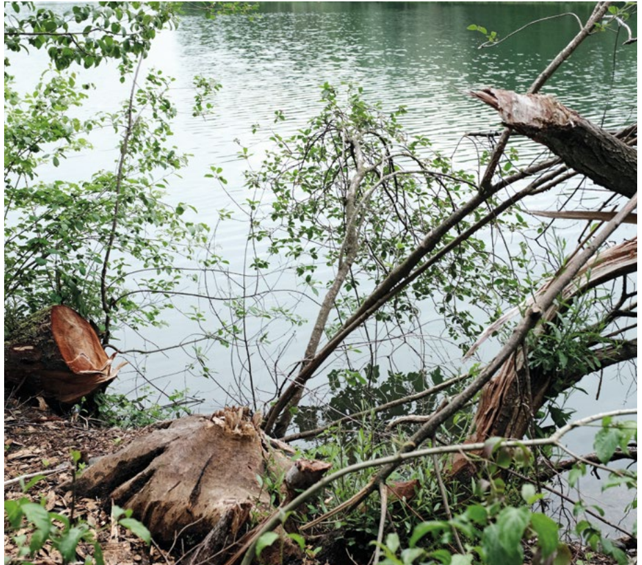
Abb. 1: Natürlicher Rohstoffabbau durch Biber

Ein zentraler Schwerpunkt ist dabei die Umsetzung der Kooperationsvereinbarung des Runden Tisches Landwirtschaft und Naturschutz, in dem gemeinsam mit den Verbänden viele sinnvolle Maßnahmen, unter anderem für Offenlandarten und den Insektenschutz, vereinbart wurden. Die Feldflurprojekte für Arten wie zum Beispiel Rebhuhn, Feldhamster (Abb. 2) und Grauammer sind schon sehr erfolgreich. Die vor ein paar Jahren als Maßnahmenräume für Schwerpunktvoorkommen testweise gestarteten Projekte möchten wir jetzt fest in die hessische Naturschutzarbeit integrieren, mit einem systematischen Monitoring versehen und dort, wo es sinnvoll ist, ausweiten. Für viele von Hessens Offenlandarten wird von großer Bedeutung sein, wie das neue Hessische Agrarumwelt- und Landschaftspflegemaßnahmen-Programm, kurz HALM-Förderung, in den nächsten Jahren ausgestaltet wird. Hier gilt es, gemeinsam mit der Landwirtschaft eine für den Natur- und Klimaschutz sinnvolle