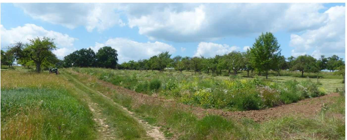
Abb. 5: Blühfläche in Lich-Bettenhausen mit Schwarzbrachestreifen und Anbindung an Feldwege und Streuobstwiesen: Anfang Juni 2022 zur Heumahd ist sie Rückzugsgebiet, wenn selbst die Wege gemäht bzw. gemulcht sind.