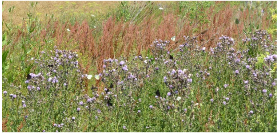
Abb. 3: Acker-Kratzdisteln, Kletten und andere „Unkräuter“ sind als selbstansiedelnde Arten nicht nur ein sehr attraktives Blütenangebot für Imagines, sondern auch Lebensraum für die Larvalstadien.

Die Grenzen des Nutzens von Blühstreifen zeigte abschließend Dr. A. Zehm vom Bayerischen Staatsministerium für Umwelt und Verbraucherschutz (StMUV) in seinem Vortrag „Hochwertige Lebensräume statt Blühflächen: In wenigen Schritten zu wirksamem Insek-