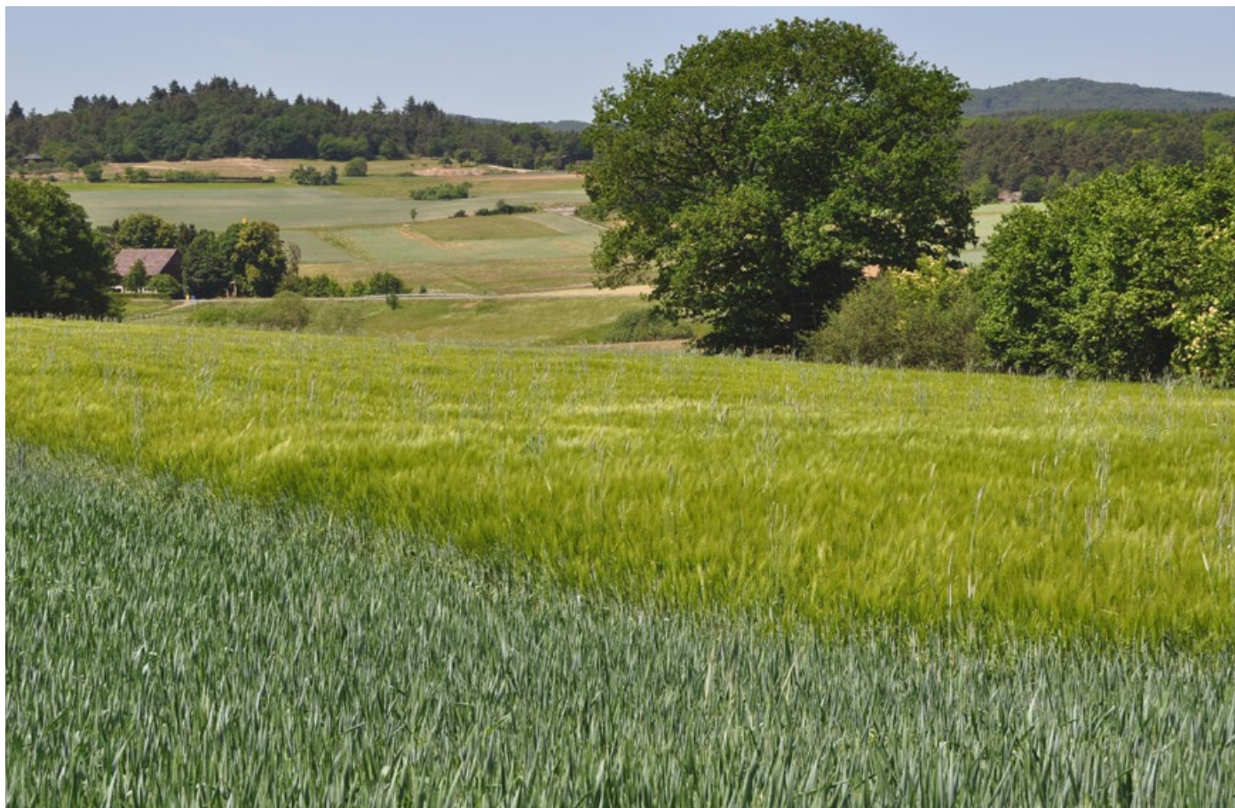
Abb. 1: Wichtige naturnabe Strukturen wie Feldgehölze und Wege werden in der Landschaft immer seltener.