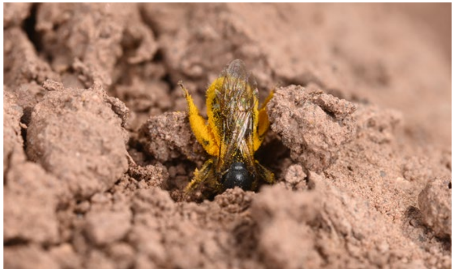
Abb. 2: An Feldwegen und -rainen finden Insekten häufig gute Bedingungen, beispielsweise zum Nisten.

Neben der Förderung der Biodiversität sollen Blühstreifen vielfältige Erwartungen erfüllen und unter anderem als lineare Vernetzungselemente fungieren und zur Verbesserung des Landschaftsbilds und des Images der Landwirte beitragen. Inwieweit sie auch als Ausgleichsmaßnahmen bei der Biogasproduktion eingesetzt werden können, stellte Dr. N. Wix, ehemals Universität Hannover, in ihrem Vortrag „Blühstreifen – Biodiversität und produktionsintegrierte Kom-