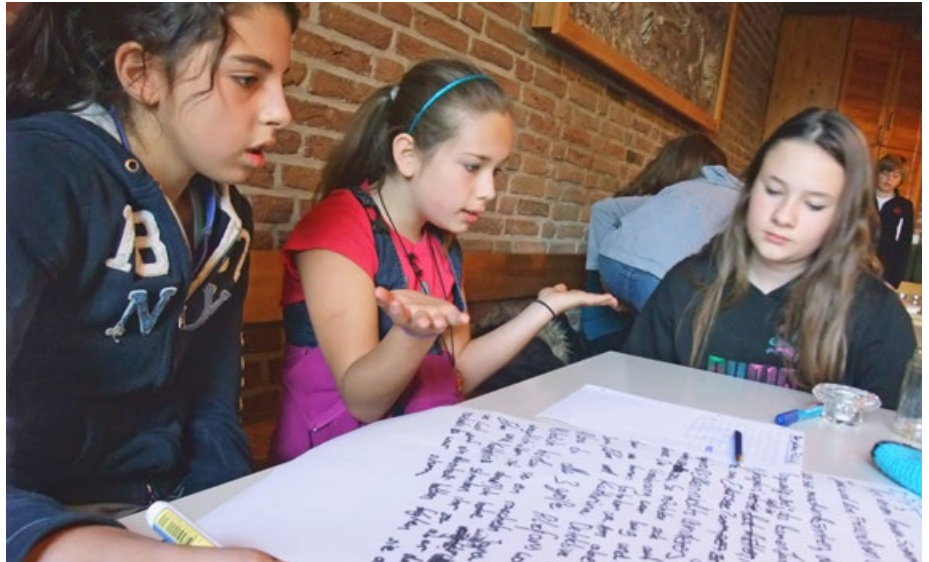
Abb. 4: Reflexionsarbeit im Anschluss an die Wildnisexpedition

„Endlich bin ich mal in einem richtigen Wald, unser Wald daheim ist ja nur so groß wie die Plane“: Der Satz einer jun-