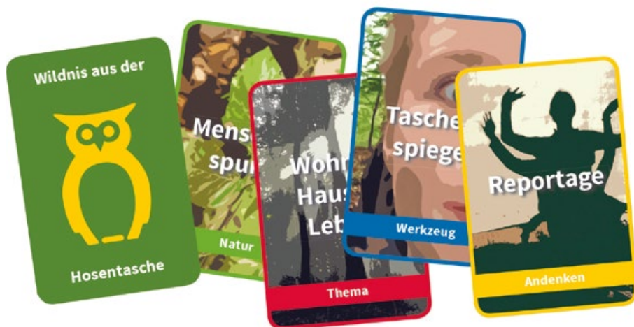
Abb. 5: Das Kartenspiel „Wildnis aus der Hosentasche“ als didaktisches Hilfsmittel für interaktive Führungen

Die erste Fortbildung in Kooperation mit der NAH fand im Jahr 2019 auf einer etwa 60 ha großen Naturwaldentwicklungsfläche bei der Jugendburg Hessenstein im Naturpark Kellerwald-Edersee statt. Dabei wurden die Teilnehmenden zuerst mit Wahrnehmungsübungen wie Schleichgang, Beobachtungsplatz und Erweiterung des Blickfeldes sensibilisiert, um sich dann mit dem Bau eines spurenarmen Biwaks zu befassen. Bei der zweiten Fortbildung ein Jahr später auf einer etwas kleineren Naturwaldentwicklungsfläche bei Waldsolms im Naturpark Taunus stand die interaktive Gestaltung von Wildnisführungen im Mittelpunkt. Nach einer Einführung in die Wildnisbildung und einer Musterführung galt es, anhand des Kartenspiels „Wildnis aus der Hosentasche“ eigene interaktive Führungen zu konzipieren und mit den anderen Teilnehmenden durchzuführen. Da der moderne Kulturmensch oftmals Angst vor dem wilden Unbekannten hat, kam auch immer wieder die Auseinandersetzung mit dem einfachen Leben in der Natur zur Sprache. Wir sind es gewohnt, stets ein sicheres Dach über dem Kopf zu haben und den gefüllten Kühlschrank immer in Griffweite zu wissen. So spielten der Umgang mit den eigenen Grundbedürfnissen und der dadurch beeinflussten Gruppendynamik