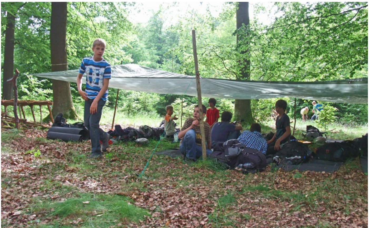
Abb. 3: Übernachtet wurde während der Wildnisexpedition unter einfachen Biwakplanen.