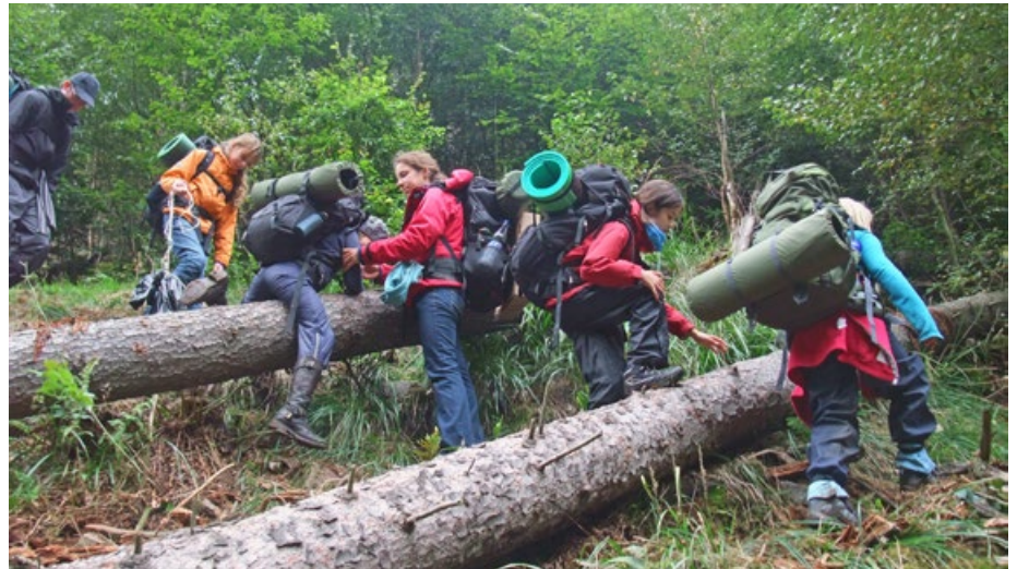
Abb. 2: Jugendliche während des Praxisprojekts „Waldscout – Wildnisexpedition“

sack“, die das Wagnis des Aufbruchs ins Neue und den Suffizienzgedanken des Nachhaltigkeitsansatzes repräsentieren, eine zentrale Rolle (LANGENHORST 2014). Der erlebnispädagogische Ansatz der „Expedition“ nimmt Menschen mit auf eine Entdeckungs- oder Forschungsreise in für sie bislang unbekannte Welten (HECKMAIR & MICHL 2018) und