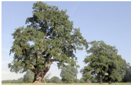
Abb. 5: Gruppe Bebercker Hute-Eichen, die in dieser Perspektive in „Ostwind“ und „Ostwind 2“ auftritt und, anders fotografiert, in „König Drosselbart“ und weiteren Filmen

Wildnis ist heute Programm, und sie und ihre verwandten Begriffe waren in dieser Liste wiederkehrender Nenner. Real waren sie aber bestenfalls in Illusionen anzunähern, ob nun für Filmmacher oder ganz allgemein, und gerade in der Mitte eines Landes „ohne Raum“, dessen subventionierte „Fluchtwege“ zu Luft und sonstige „Grenzüberschreitungen“ nicht erst GROENEVELD (1988) reklamierte. Nach so viel Ernüchterung kann es dann nur zynisch wirken, wenn ein ganz junger Film die Wildnis plötzlich gefunden haben will, inklusive passendem Rezept: „Selbstversuch Survival – Überlebenstraining im Reinhardswald“ von Nathaly Janho.