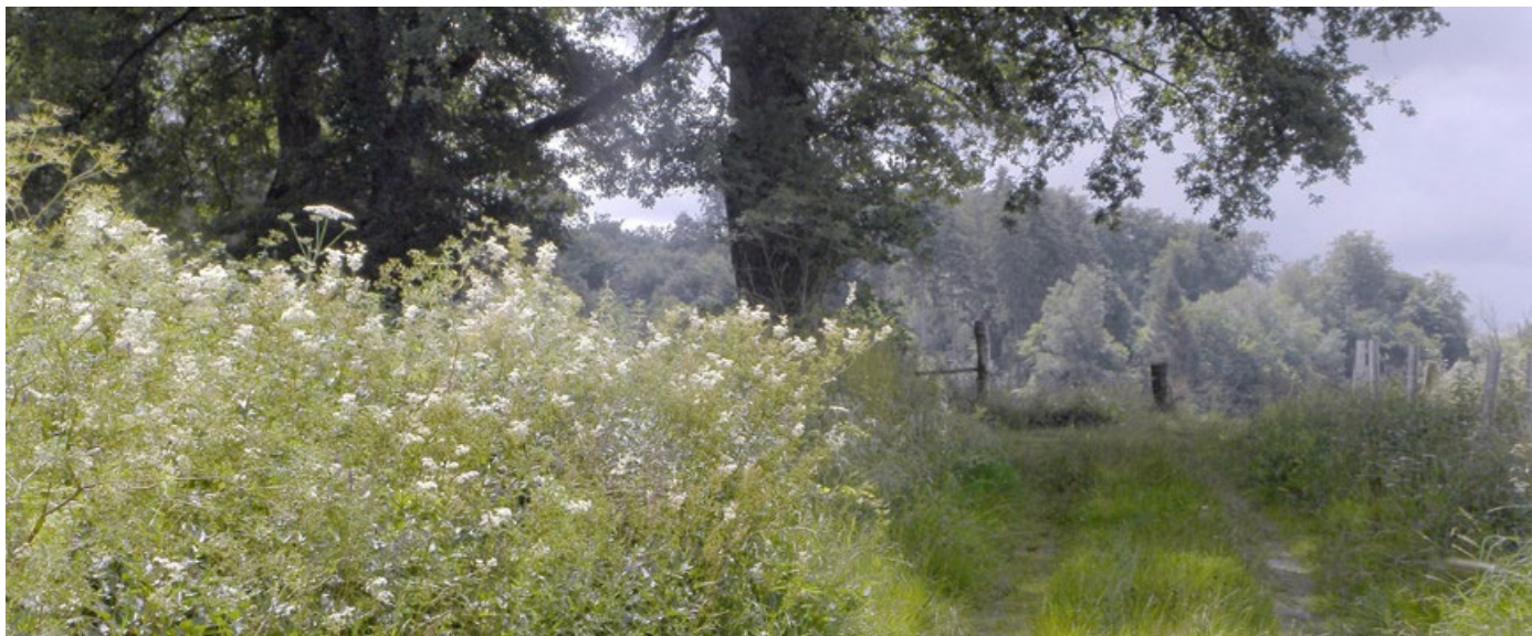
Abb. 4: Traditionell ländliche Szenerie im Reinhardswald mit Eichenpfosten-Koppelzäunen. Die reichen Mädesüß-Bestände beherbergen den im ausgeräumten Offenland längst verschwundenen Mädesüß-Perlmutterfalter (Brenthis ino).

uns singt“. Es offeriert einen ganzen Reigen an „Reisen zum Wald“ aus Musik, Bildender Kunst, Geschichtsschreibung und mehr, kann diese aber naturgemäß jeweils nur ganz kurz anreißen. Die Rahmenhandlung bildet ein Vertreter unserer „Beschleunigungsgesellschaft“ (HEY 2019), der sich mit seinem BMW auf einem stillen Waldsträßchen wiederfindet. Er hat gerade vom Hemelberg herauf die Kühbacherwiese passiert (der Film ist aber allgemeingültig), als ihn das Autoradio mahnt: „Du siehst den Wald vor Bäumen nicht!“ Doch er gibt weiter hektisch Gas, bis ihm endgültig der Kragen platzt, weil er nicht überholen kann. Er stoppt abrupt, springt hinaus und schleudert Anzug und Aktenkoffer von sich. So befreit rennt er in den Wald und lernt langsam diesem zuzuhören.