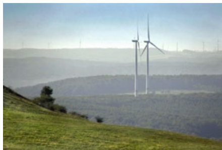
Abb. 2: Fotostandpunkt etwas höher an der Kuppe aus Abb. 1: Die landschaftliche Symbolik ändert sich.