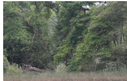
Abb. 6: Ein Stückchen Wildnis (?) im Reinhardswald. Ob wohl Tacitus ähnliche Vorstellungen von den schaurigen Urwäldern und Mooren in der Germania hatte? 2000 Jahre später nimmt „Was der Wald uns singt“ Bezug auf sie.