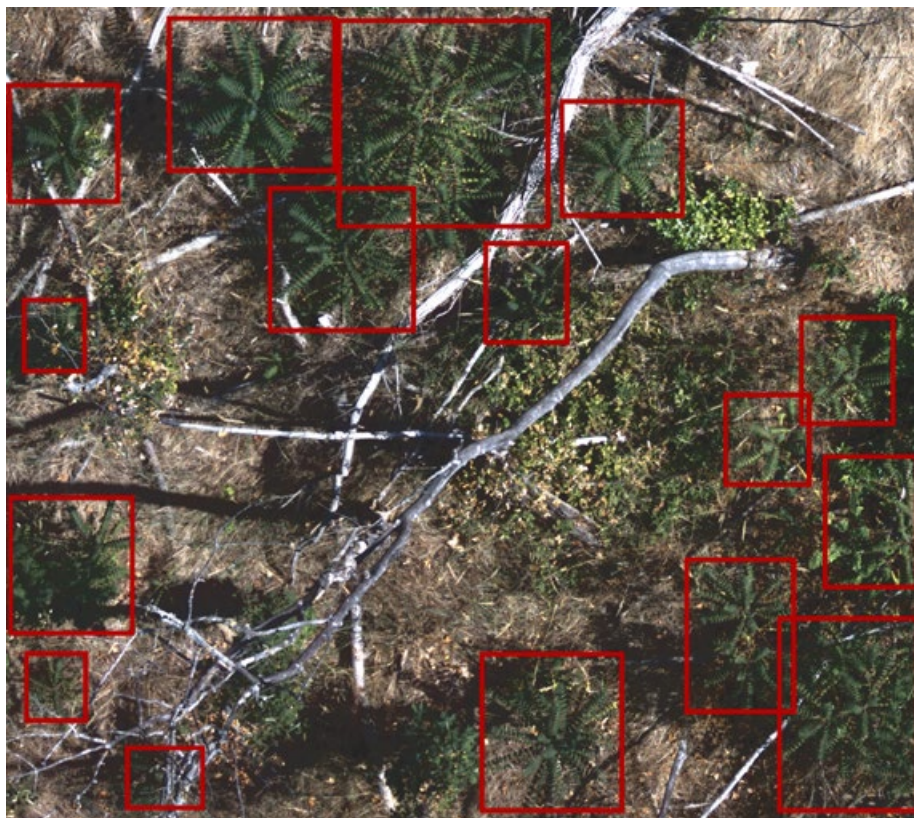
Abb. 1: Aufwuchs mehrerer junger Götterbäume in einer Waldlichtung umgeben von liegendem und stehendem Totholz aus der Drohnenperspektive