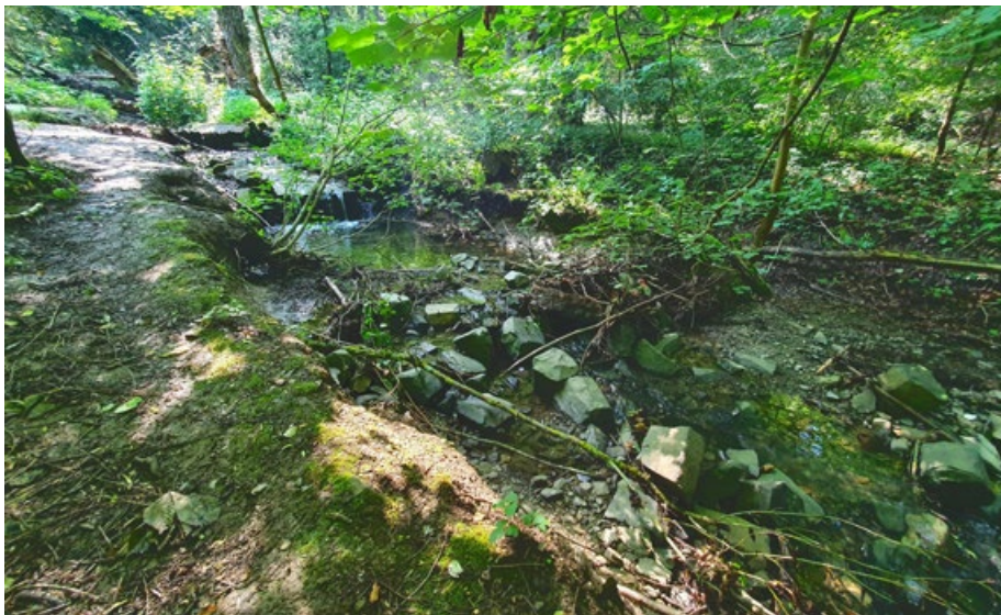
Abb. 3: Ein Teilabschnitt des untersuchten Bereiches des Helgebachs, Wetzlar

von Bsal frühzeitig zu ermitteln, werden in ganz Hessen Populationen stichprobenartig auf den Hautpilz untersucht. Von adulten Tieren werden Hautabstriche genommen und mittels qPCR auf den Pilz getestet. Zusätzlich werden die Larvenanzahlen der Populationen überwacht, um frühzeitig akute Schwankungen feststellen zu können.