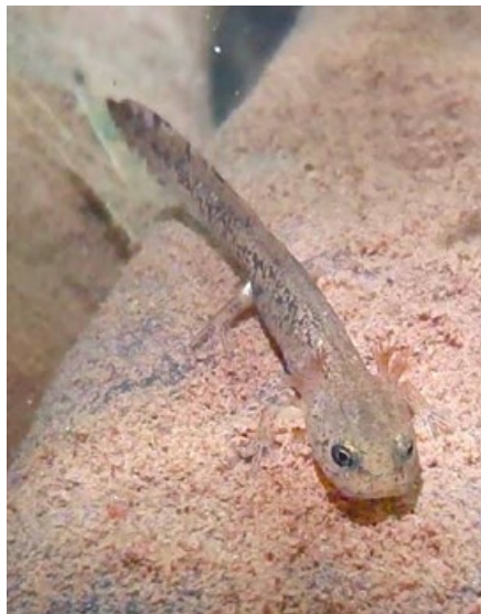
Abb. 2: Junge Feuersalamanderlarve im Helgebach, Wetzlar

Feuersalamander im Wasser (Abb. 2) (SEIDEL et al. 2016, VEITH et al. 2022). Zur Geburt suchen Weibchen geeignete Larvengewässer auf. Bereits im Mutterleib platzt die Eihülle und die Larve wird vollständig entwickelt abgesetzt. Im Schnitt gibt ein Weibchen 20 bis 40 Lar-