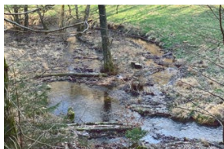
Abb. 3: Angekaufte Grundstücke geben dem Gewässer Raum.