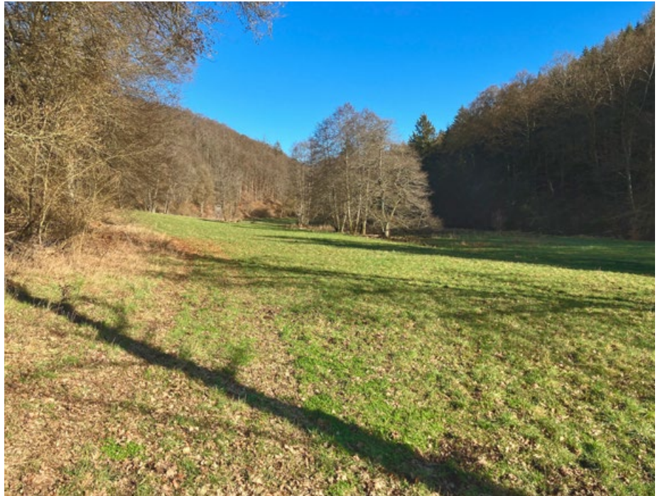
Abb. 1: Wiesental im NSG „Tringensteiner Schelde“

Mit den geplanten Naturschutzmaßnahmen sollen die Zielsetzungen des Integrierten Klimaschutzplan Hessen (HMUKLV 2017) in den Handlungsfeldern L14/L28 (im neuen Klimaschutzplan im Handlungsfeld LN 10 – „Biotopverbund für klimasensible Arten verbessern“ zusammengefasst) unterstützt werden. Das Projekt bedient mit seinen Zielsetzungen beide oben genannten Handlungsfelder. Zum einen wird mit den geplanten Maßnahmen die Aue der Tringensteiner Schelde renaturiert und der Wasserrückhalt gefördert. Zum anderen werden Arten, welche durch den Klimawandel in ihrer Bestandsentwicklung zurückgehen, unterstützt. Die Gelder für den Flächenerwerb und die anschließenden Maßnahmen wurden aus Mitteln des Integrierten Klimaschutzplan Hessen (IKSP) zur Verfügung gestellt.