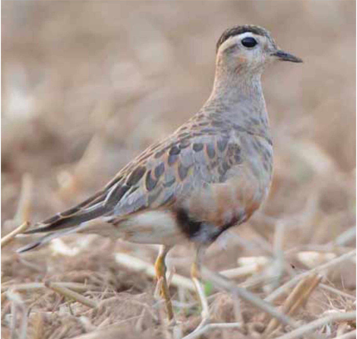
Mornellregenpfeifer Charadrius morinellus .

17.08.2014: Gut Seligenstadt. 12 Mornellregenpfeifer, zunächst im Flug, später auf einem Feld. (Mitbeobachter: F. Heiser)