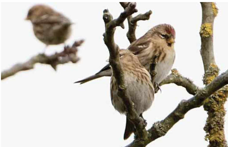
Alpenbirkenzeisige. 20.12.2014. Harrbach.