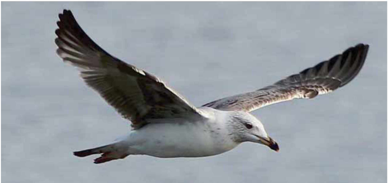
Mittelmeermöwe im 2. Winter.