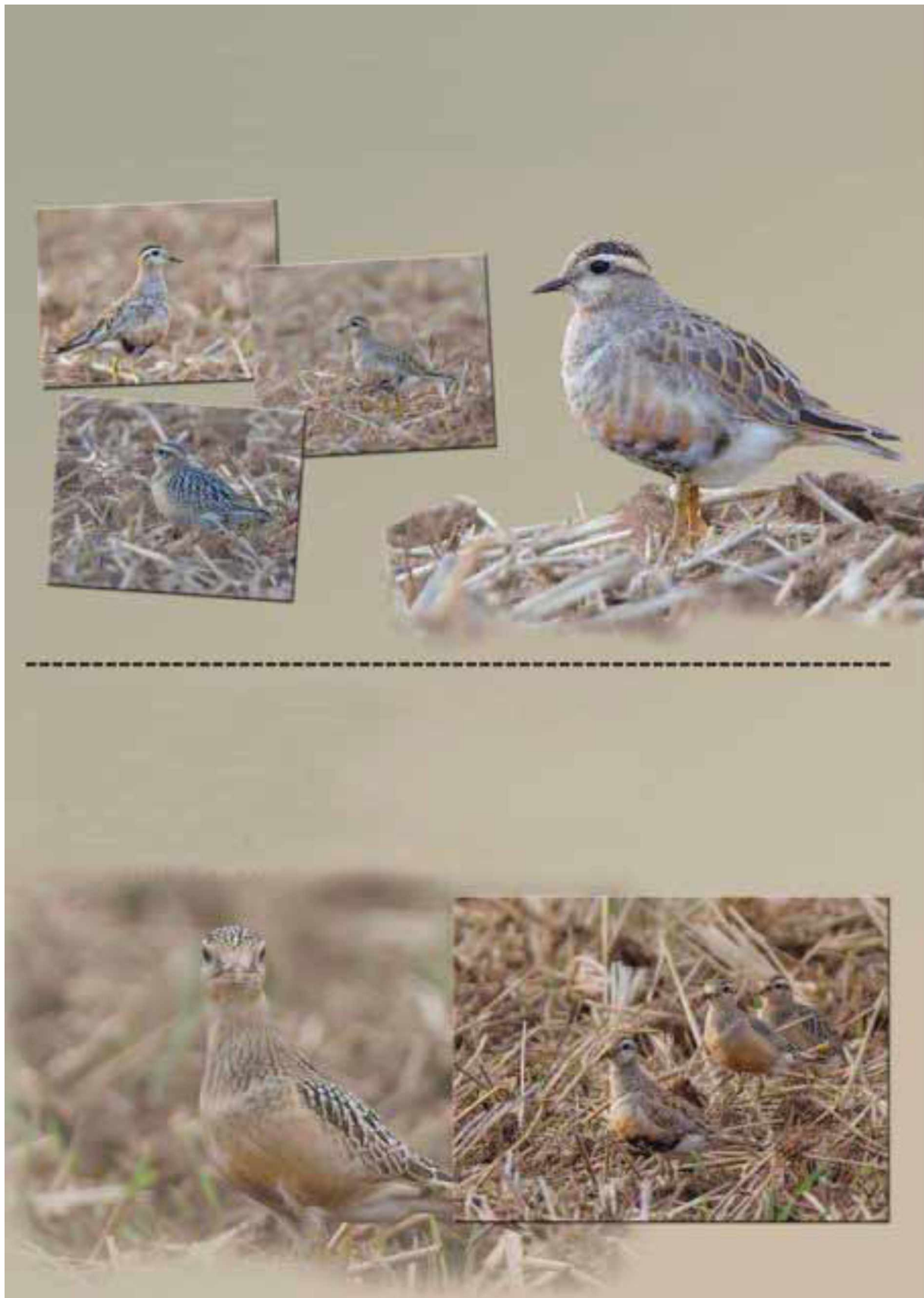
28.08.2014: Gut Seligenstadt, zunächst 3, später insgesamt 9 Mornellregenpfeifer.