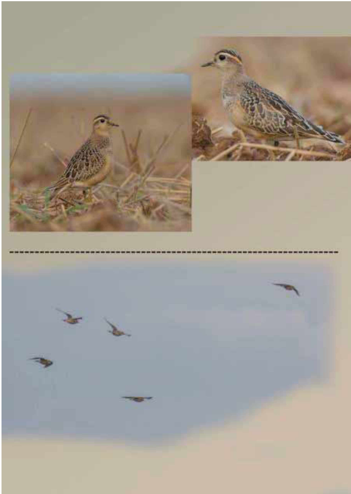
Oben: 01.09.2014: Gut Seligenstadt. 1 juveniler Mornellregenpfeifer.