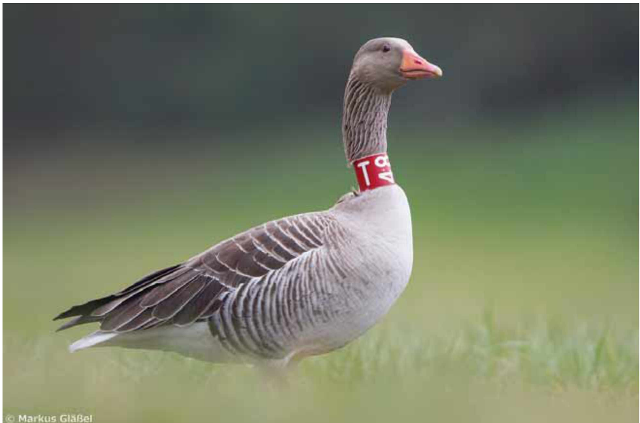
Graugans. Erlabrunn.

Die Gans wurde am 09.06.2012 im Süden Tschechiens beringt. Sie begab sich dann auf Wanderschaft nach Brandenburg, Sachsen und Thüringen, wurde Ende Februar 2014 von einem “Markus” bei Hörblach gesichtet und ist nun in Erlabrunn angekommen. Nun ist klar, dass eine Durchmischung stattfindet und Graugänse auch über weite Strecken ziehen.