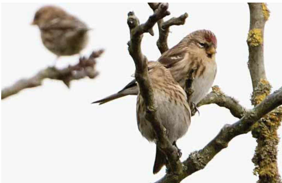
Alpenbirkenzeisige. 20.12.2014. Harrbach.