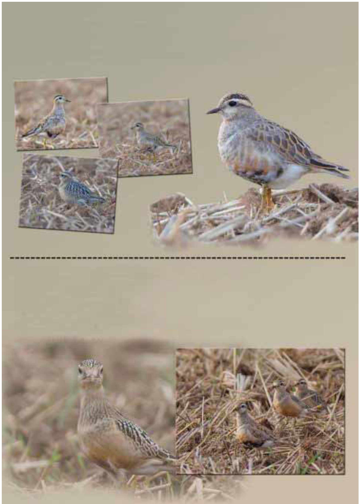
28.08.2014: Gut Seligenstadt, zunächst 3, später insgesamt 9 Mornellregenpfeifer.