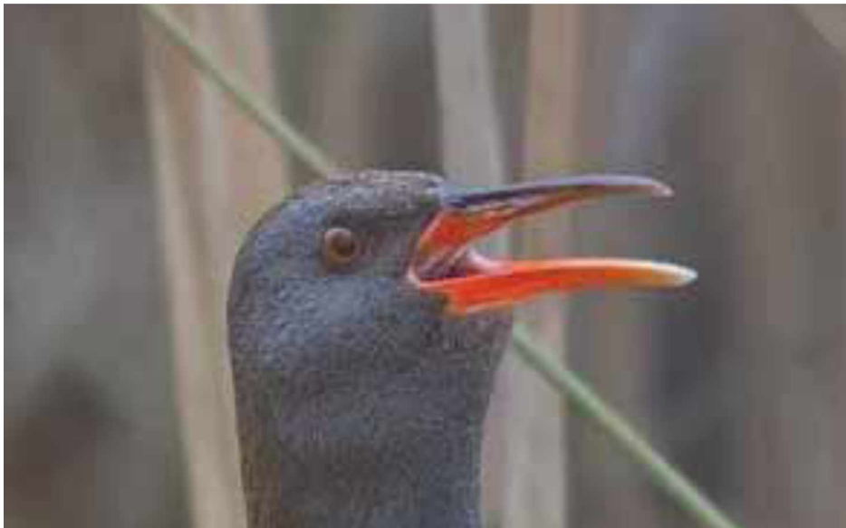
Männliche Wasserralle zeigt Territorialverhalten. 14.03.2015. Sauerstücksee/Lkr. Sw.

Diskussion: Vermutlich ist die Population der Wasserralle um diesen Sauerstücksee im Vergleich zum Diebacher Schilf an der Saale deutlich größer, so dass der Revierdruck evtl. zu dieser intensiven Auseinandersetzung führte. Interessant ist auch, dass das Männchen schon im Februar eine Kerbe im Bauchgefieder zeigte. Das deutet darauf hin, dass sich der Brutfleck schon gebildet hat. Näheres zum Brutfleck der Wasserralle siehe OAG Jahrbuch 2014 S. 132. http://www.naturgucker.de/files/Publikationen/Jahrbuch2014OAGUfr_2.pdf .