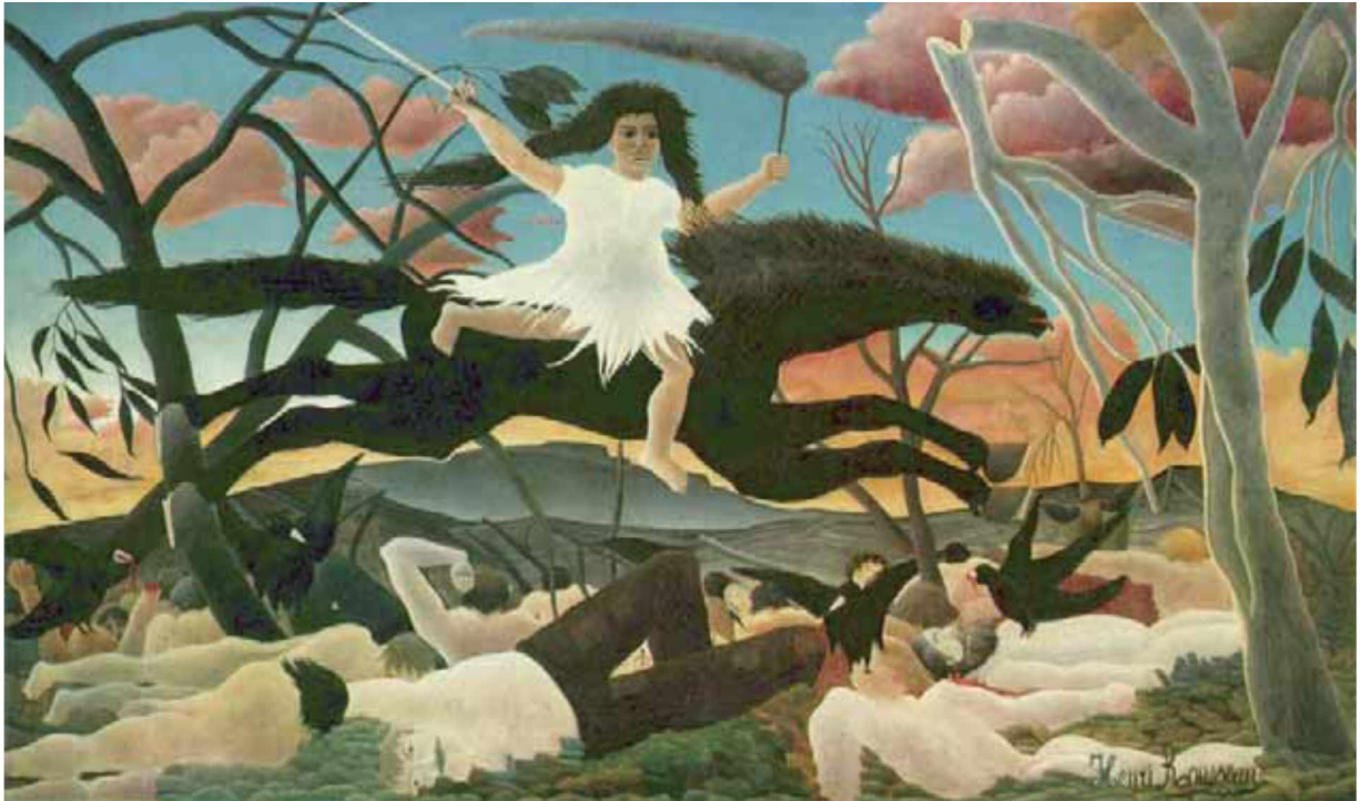
Henri Rousseau. La Guerre ou la chevauchée de la discorde. 1894. Öl auf Leinwand. Musée d'Orsay, Paris.

Ganz anders verstand Vincent van Gogh die Raben, denn er war ein Vogelfreund. In seiner ersten Zeit als Maler in Nuenen veranlasste er die Burschen, ihm Vogelnester ohne und mit Eiern zu bringen. Dann malte er einige sehr dunkle Ölbilder von den Nestern. Das Van Gogh Museum in Amsterdam zeigt neben solchen Bildern auch ein Eisvogel-Präparat aus der Sammlung des Malers.