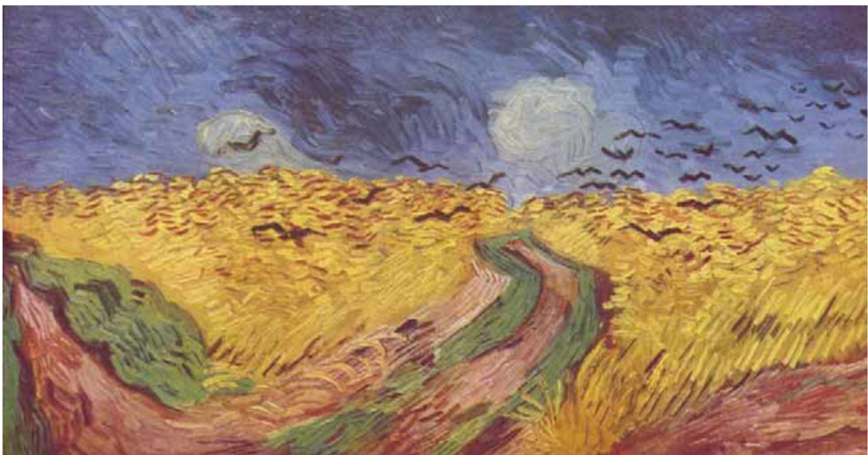
Vincent van Gogh. Auvers-sur-Oise, Juli 1890. Öl auf Leinwand. 50,5x103 cm. Amsterdam, Van Gogh Museum (Vincent van Gogh Stiftung)

Bei einem der letzten Bilder von Vincent van Gogh mit dem Titel „Weizenfeld mit Raben“ hat die Forschung lange Zeit nicht bedacht, dass van Gogh ein großer Vogelfreund war. Es wurde „ziemlich einhellig“ behauptet, „in diesem Gemälde habe van Gogh seinen Vorahnungen den düstersten Ausdruck gegeben [---]. Drohendes Unheil fühle man nahen angesichts der Vögel, die vom Horizont aufsteigen und an den Vordergrund herandrängen; Ausweglosigkeit finde man umschrieben in den drei morastigen Wegen [---].“ 72 Und es geht die Legende, dieses großformatige Ölbild sei an dem Tag auf der Staffelei gestanden, als er sich am 27. Juli 1890 in die Brust schoss. Am 29. Juli 1890 starb Vincent van Gogh an den Folgen der Schussverletzung.