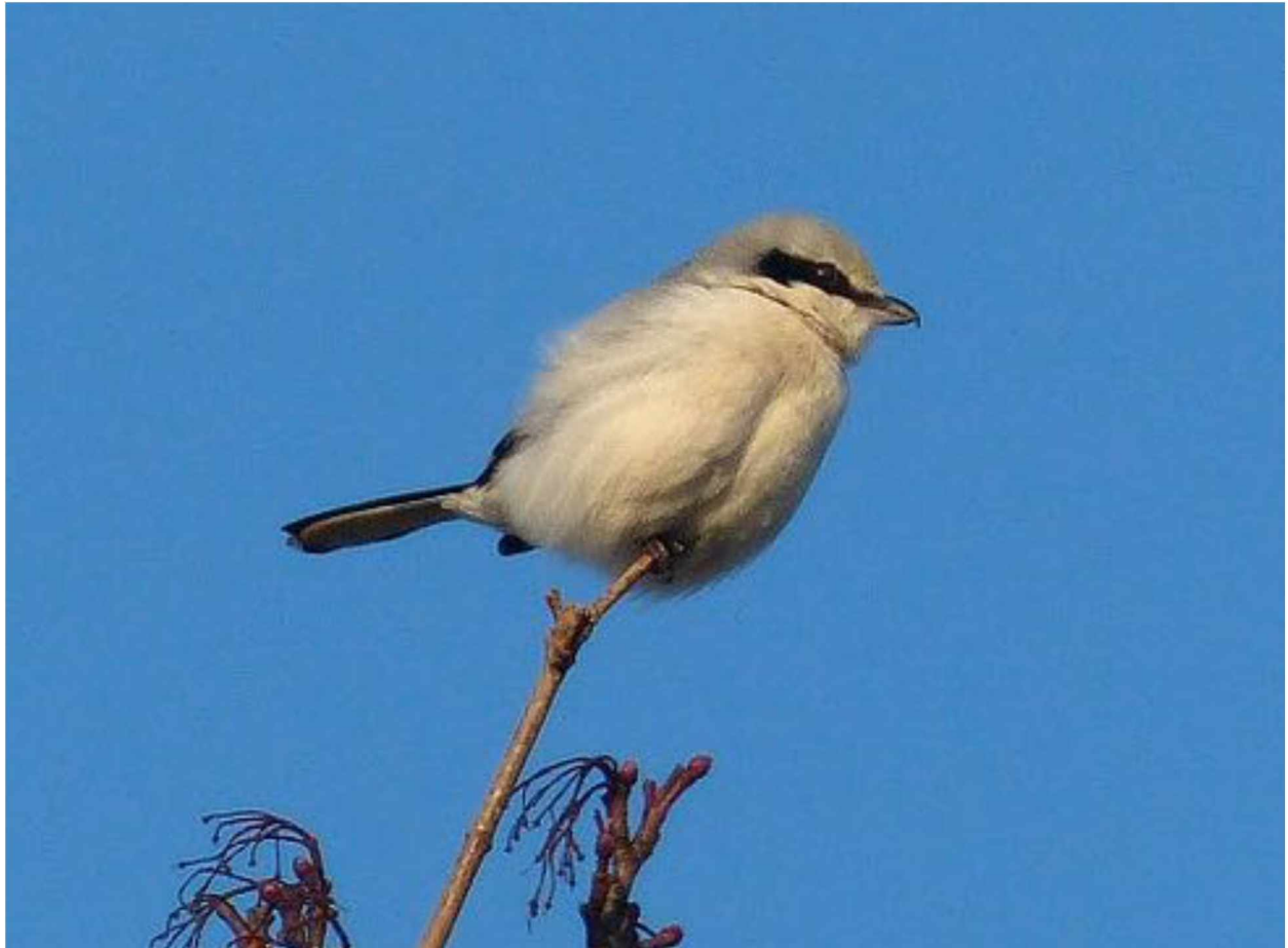
Raubwürger im Winterrevier bei Euerfeld.

Diskussion: Dank der kontinuierlichen Meldungen v. a. von F. Rüppel kann man von 11 besetzten Winterrevieren ausgehen. Es fehlen heuer Meldungen aus dem nördlichen Bereiche unseres Arbeitsgebietes.