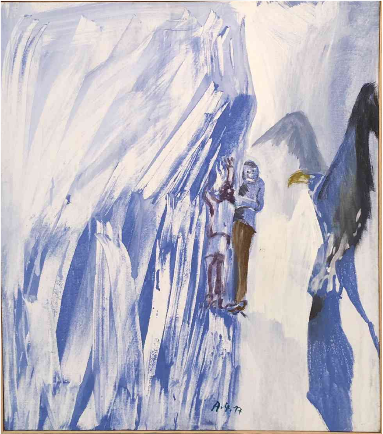
Siegfried Anzinger: Blaue Wand. 2017. Leimfarbe auf Leinwand. Privatbesitz.