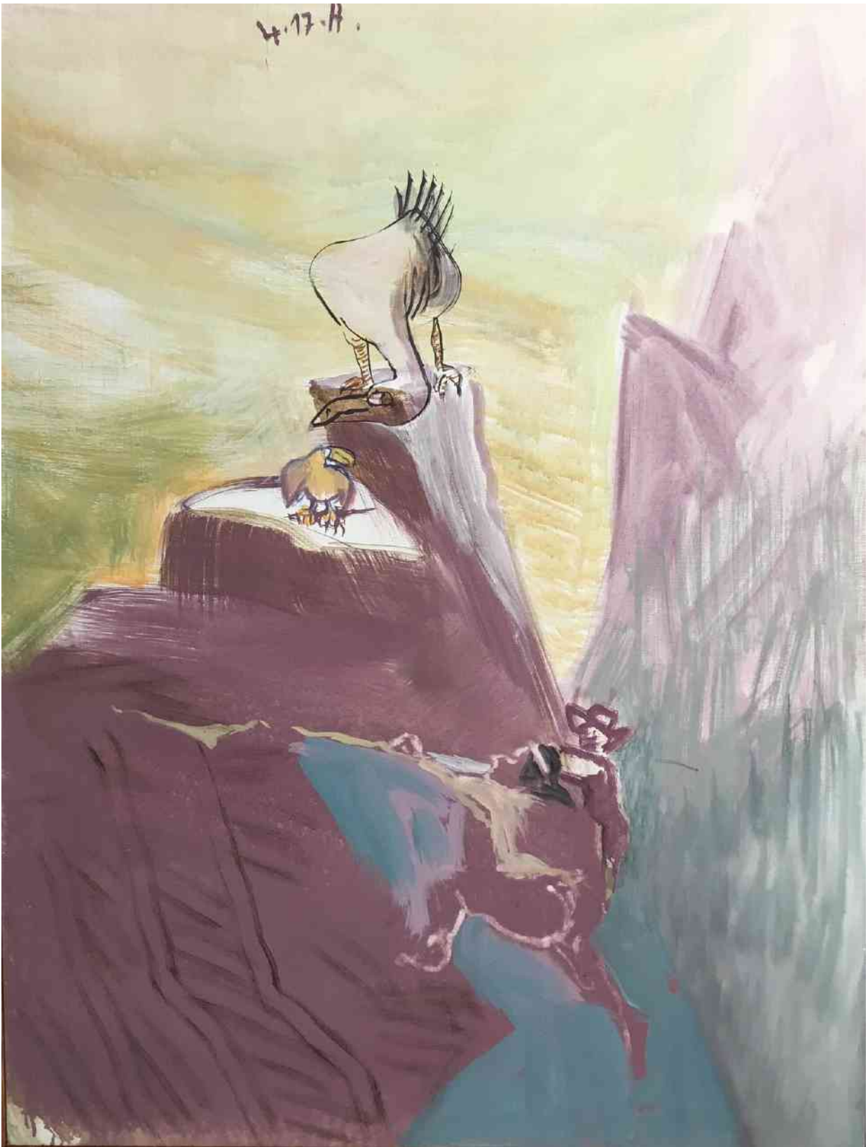
Siegfried Anzinger: Geier, rübenrot. Leimfarbe auf Leinwand. Privatbesitz.