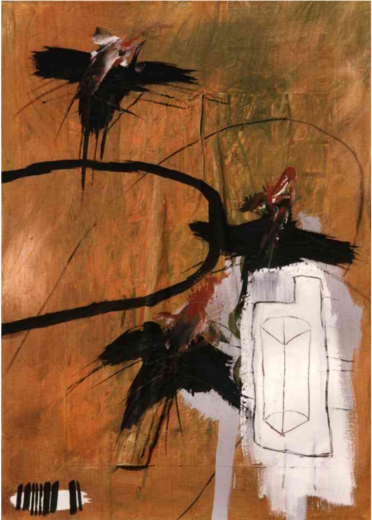
Aufwärts. Acryl auf Leinen. 50 x 70 cm, 1991. Im Besitz des Künstlers.