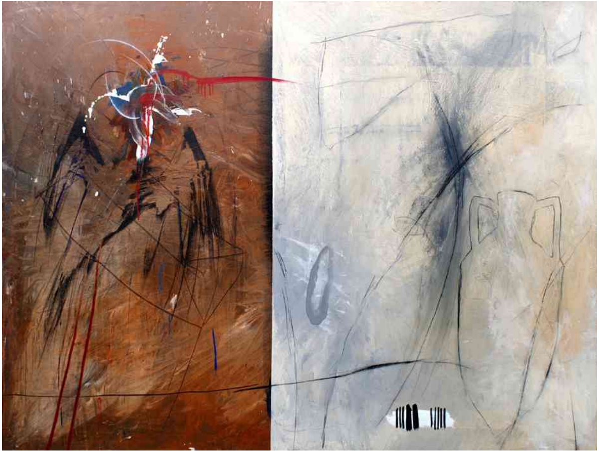
Oben: "Kranich", 160 x 120 cm; 1991; Acryl auf Leinwand. Sammlung Würth, Künzelsau. Unten: "Pelikan", 160 x 120 cm; 1991; Acryl auf Leinwand. Sammlung Würth, Künzelsau