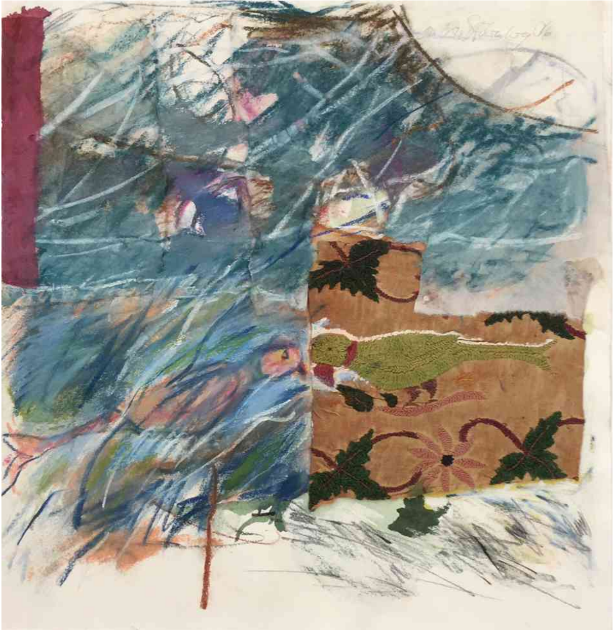
Cornelia Krug-Stührenberg: Artverwandte. Mixed Media. 2016