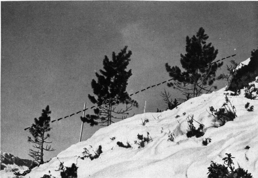
Abb. 8. Durch die Kieferschütte geschädigte Zirben. Die vom Pilz befallenen Kronenbezirke sind entnadelt bzw. vertrocknet und im Frühjahr leuchtend rot gefärbt. Während die größeren Zirben nur partielle Schäden aufweisen, sind zwei kleine Zirben im Bild rechts dem Pilz zum Opfer gefallen. Die obere Begrenzung der Schadenszone (gestrichelte Hilfslinie) fällt mit der im vorübergehenden Winter vorherrschenden Schneehöhe zusammen