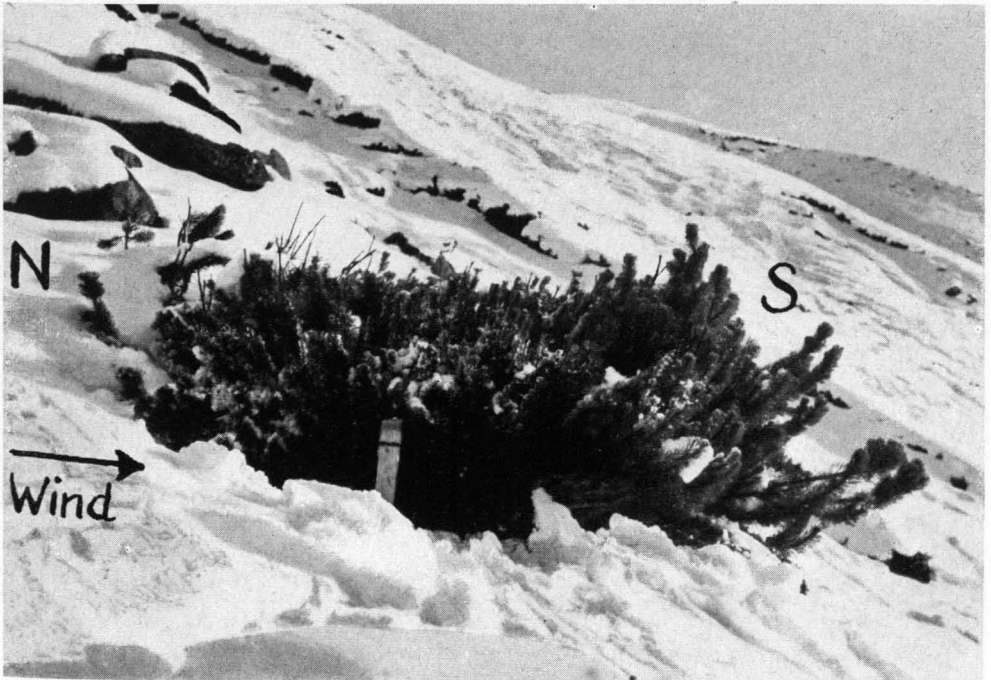
Abb. 6. Pultlatsche im oberen Teil der Kampfzone. Die dem Wind ausgesetzte Nordflanke der Krone ist schwer geschädigt, die im Windschatten liegende Südflanke völlig gesund. Durch das ungleiche Wachstum der beiden Kronenseiten entsteht die charakteristische Wächtenform