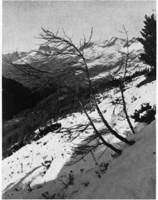
Abb. 5. Der jeden Winter auf die jungen Stämme von Lärchen wirkende Druck kriechender Schneemassen hat zu bleibenden Verbiegungen der Achsen geführt. Der „Säbelwuchs“ der Lärche zeigt, welche Gewalt der Schneedruck erreicht