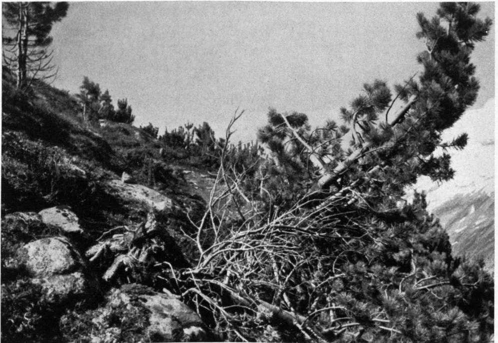
Abb. 4. Es handelt sich hier nicht um einen Lawinenwurf, sondern um vom Schneekriechen gestürzte Zirben. Diese Beschädigung trifft vor allem 2—3 m hohe Bäume, die auf steilen Hängen stocken, wo die Schneedecke langsam bergab kriecht