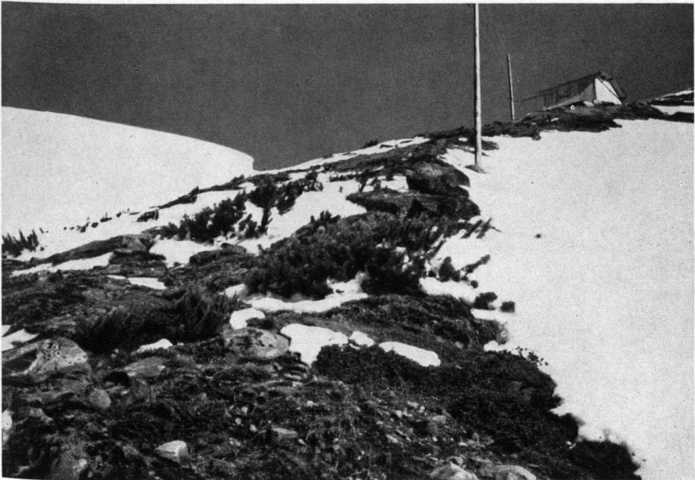
Abb. 2. Oberer Teil der Kampfzone. Es fehlt bereits völlig der Typus „Baum“. Die im Winter schneearmen, windausgesetzten Geländerippen werden jedoch von schwer geschädigten Pultlatschen und niedrigen Buschzirben bevölkert