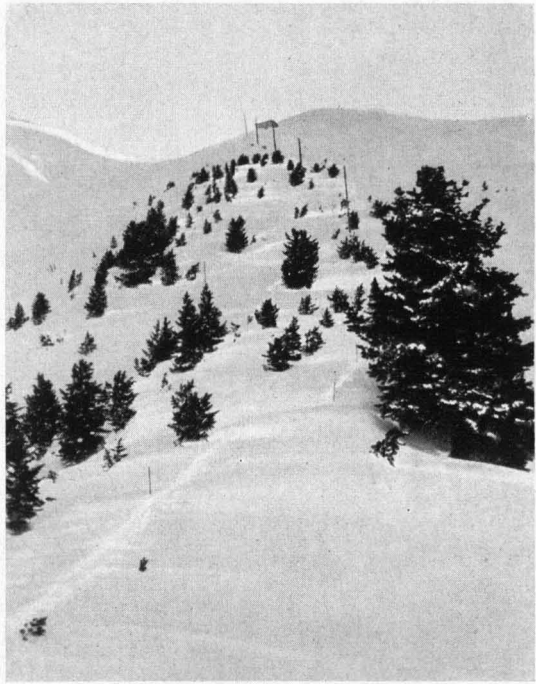
Abb. 1. Blick von der Waldgrenze (2080 m) auf die Kampfzone am Westhang des innersten Ötztals (Tirol) in der Nähe von Obergurgl. Die vorherrschende Holzart ist hier die Zirbe, die im aufgelockerten Bestand bis 2150 m steigt, ihre obere Ausbreitungsgrenze erst bei 2280 m erreicht