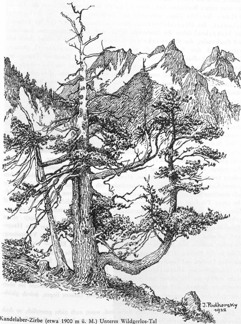
Kandelaber-Zirbe (etwa 1900 m ü. M.) Unteres Wildgerlos-Tal