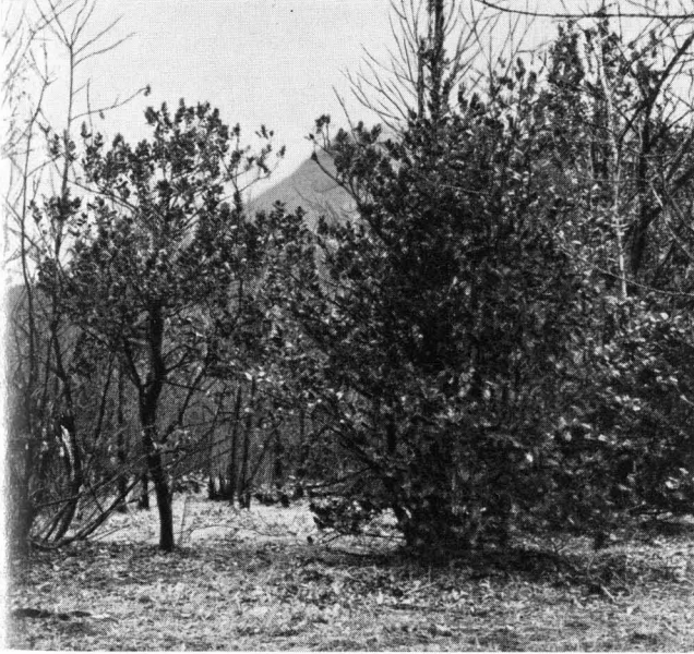
Abb. 1 Baumförmige Stechpalmen in Niederwald aus Flaumeiche, Edelkastanie, Birke und Mehlbeere. Tessin, 24. April 1958