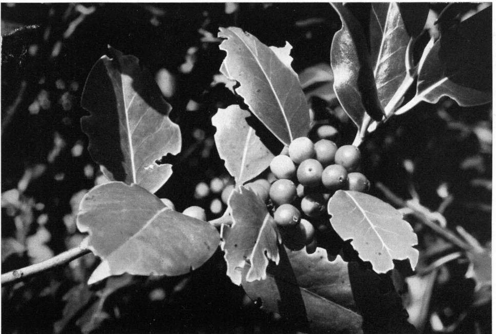
Abb. 6 Fruchtzweig der Stechpalme; 7/10 nat. Gr. — Tessin, 30. September 1957