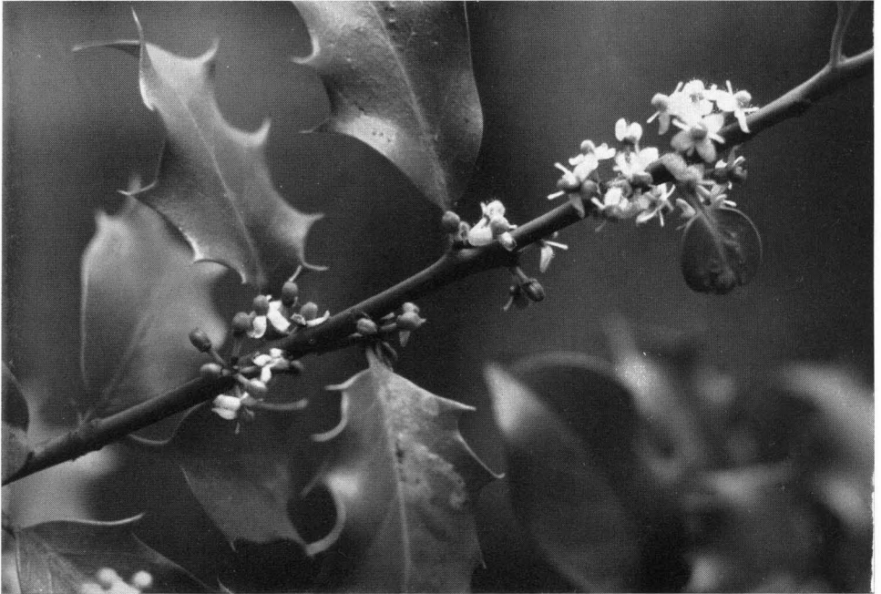
Abb. 5 Weiblicher Blütenzweig der Stechpalme, zwei Blätter mit Minen der Stechpalmenfliege; 1/1 nat. Gr. — Eifel, 28. Mai 1958