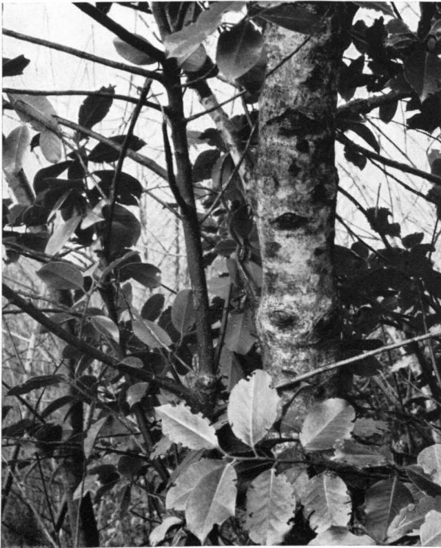
Abb. 8 Junger und alter Stamm der Stechpalme; etwa \frac{1}{8} nat. Gr. — Tessin, 24. April 1958