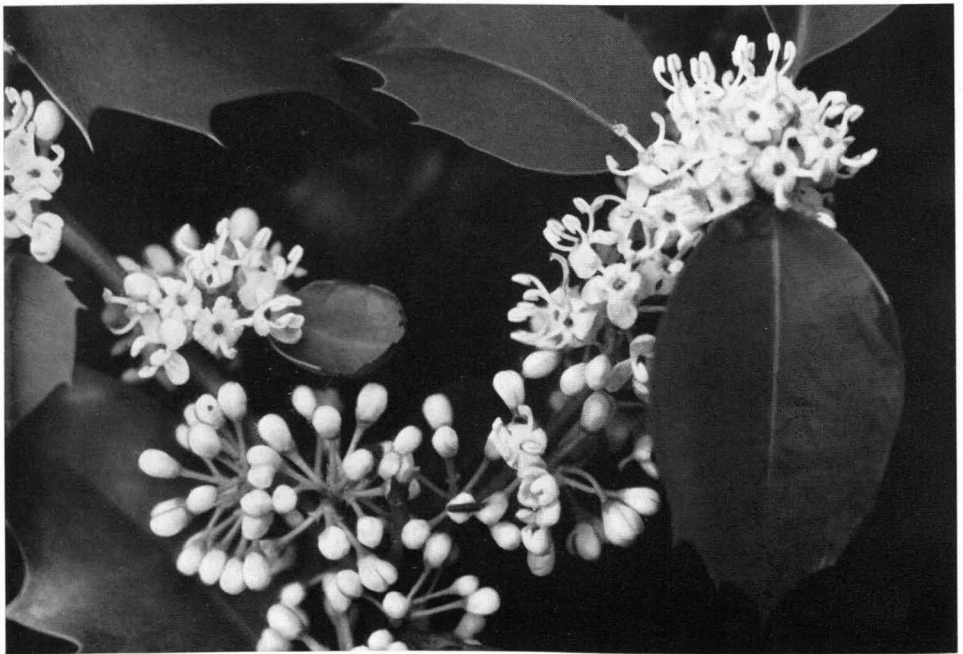
Abb. 4 Männlicher Blütenzweig der Steckpalme; \frac{9}{17} nat. Gr. — Eifel, 28. Mai 1958