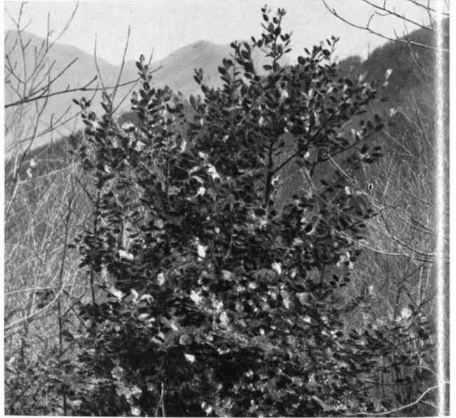
Abb. 7 Kräftiger Stechpalmen-Ausschlagsbusch. Tessin, 24. April 1958