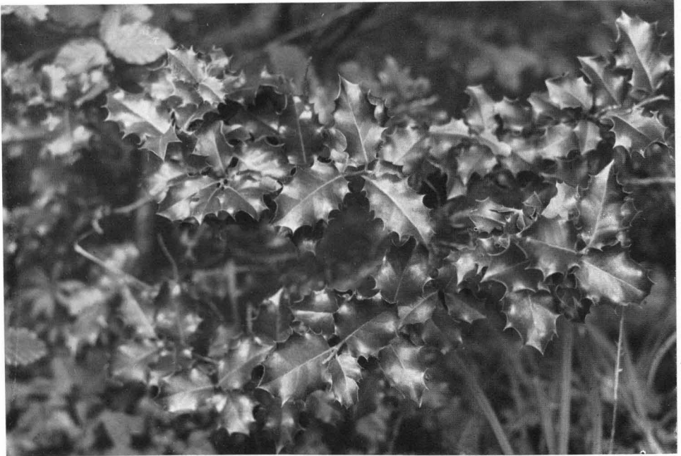
Abb. 3 Laubwerk der Steckpalme; \frac{3}{10} nat. Gr. — Wald bei Meersburg, 6. Juli 1934