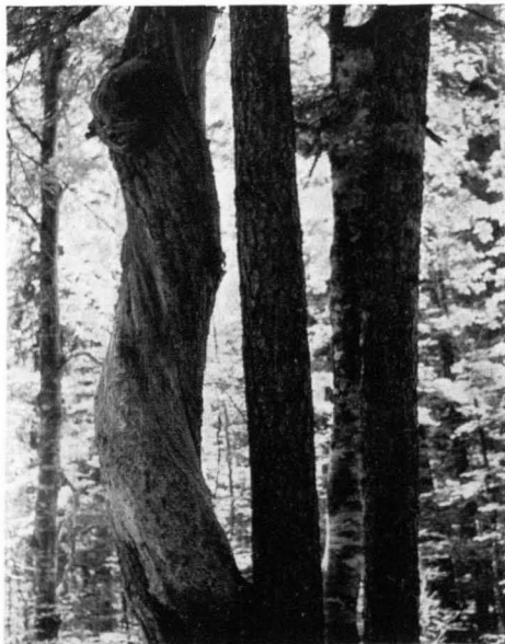
Abb. 10 Drehwuchs ist bei den alten Bäumen die Regel. Manchmal kommt es zu so bizarren Stammformen wie bei dieser schon abgestorbenen Tanne.