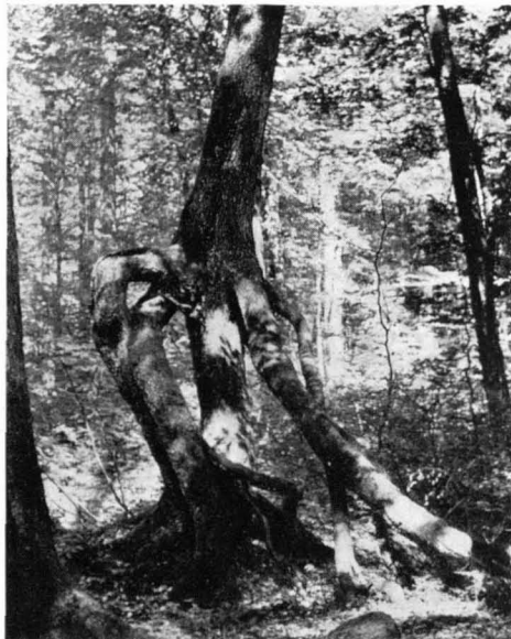
Abb. 9 Die bekannte Stelzenfichte steht auf sechs 2 m hohen Stelzwurzeln seit sich der Moderstock, auf dem sie keimte, zersetzt hat.