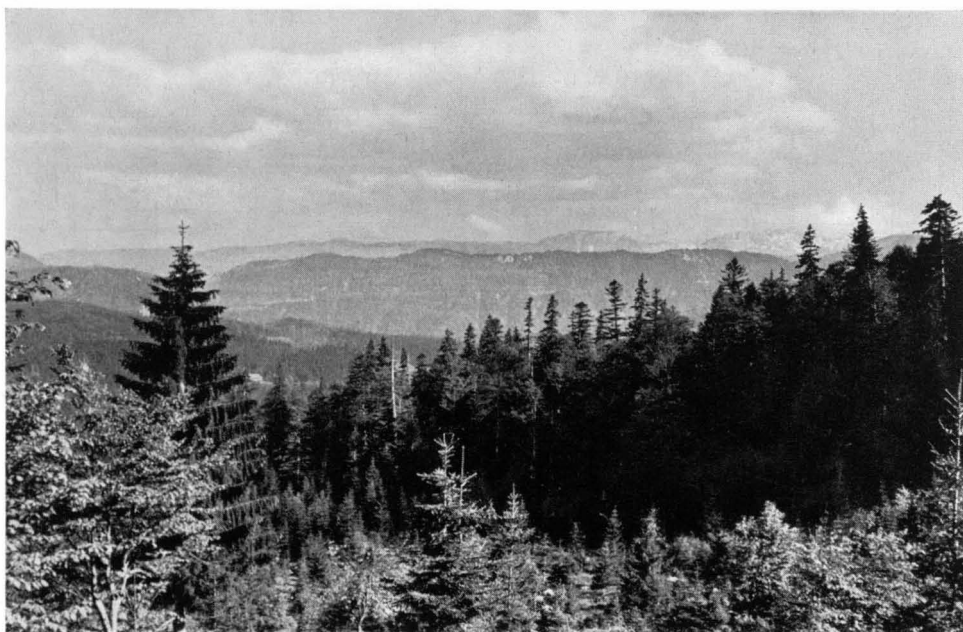
Abb. 1 Die gezackte Wipfellinie des Urwaldes Rothwald, von der „Urwaldlahn“ gesehen. In der Mitte links das Jagdhaus Langböden, im Hintergrund das Hochschwabmassiv.