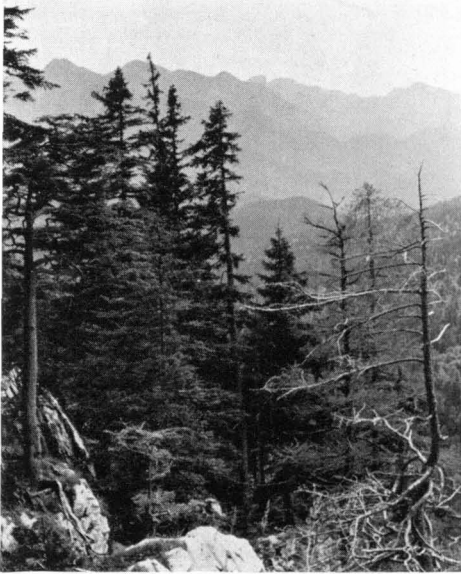
Abb. 3 Die Oberkante der Langwand im Rothwald wird von struppigen Fichten und Lärchen besiedelt. Links eine kümmernde Tanne. Seehöhe ca. 1300 m.