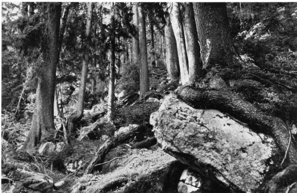
Abb. 6 Wildromantischer Blockfichtenwald im Rothwald.