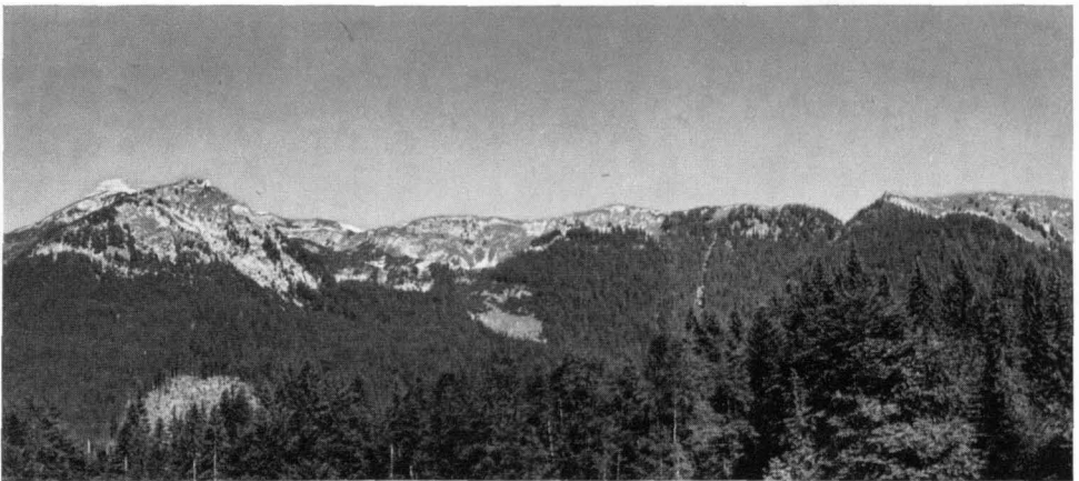
Abb. 5 Blick vom Jagdhaus Langböden auf den „Großen Urwald“, Rothwald. Links der Gindelstein (1688 m), dahinter der Dürrenstein (1878 m), in der Mitte die „Urwaldlahn“.

Der Große Urwald erstreckt sich von dem Schlag links bis nahe an den rechten Bildrand. Links vom Schlag erkennt man den einformigen Wirtschaftswald, von dem sich der Urwald mit dem helleren Grün der Buchen und den stark unterschiedlichen Baumhöhen deutlich abhebt. Im Vordergrund ebenfalls noch ein Streifen Wirtschaftswald. — Die annähernd gleich hohe Horizontlinie ist der Rand der alten Landoberfläche des Dürrensteinplateaus.