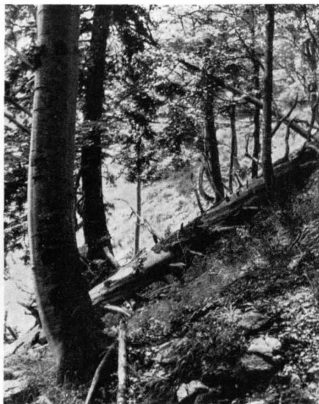
Abb. 11 In den oft licht gestellten Beständen der Hochlagen bis über 1400 m herrscht die Buche vor.