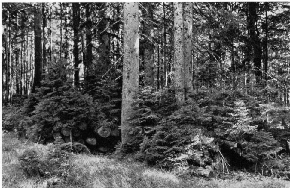
Abb. 7 Das liegengelassene Holz eines zu Jagdzwecken im Urwald angelegten Schleges hat sich ganz mit Fichtenverjüngung bedeckt.