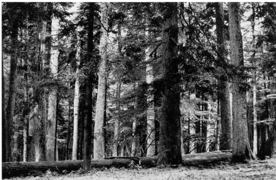
Abb. 2 Zahlreiche gewaltige Tannen bestimmen das Bild des Urwaldrestes Newwald, die Verjüngung fehlt jedoch hier fast ganz.