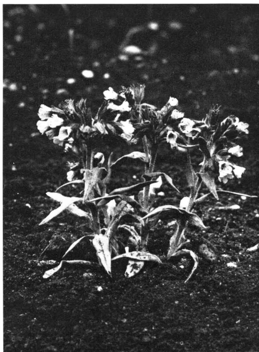
Abb. 2. Pulmonaria angustifolia vom gleichen Fundort; kultiviert im Botanischen Garten München.