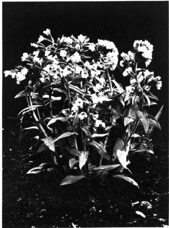
Abb. 4. Pulmonaria visianii von der Grigna (Bergamasker Alpen), kultiviert im Botanischen Garten München.