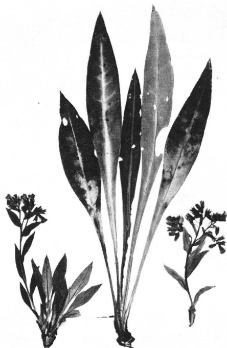
Abb. 1. Pulmonaria angustifolia von Stetten bei Karlstadt in Unterfranken. Herbarexemplare.