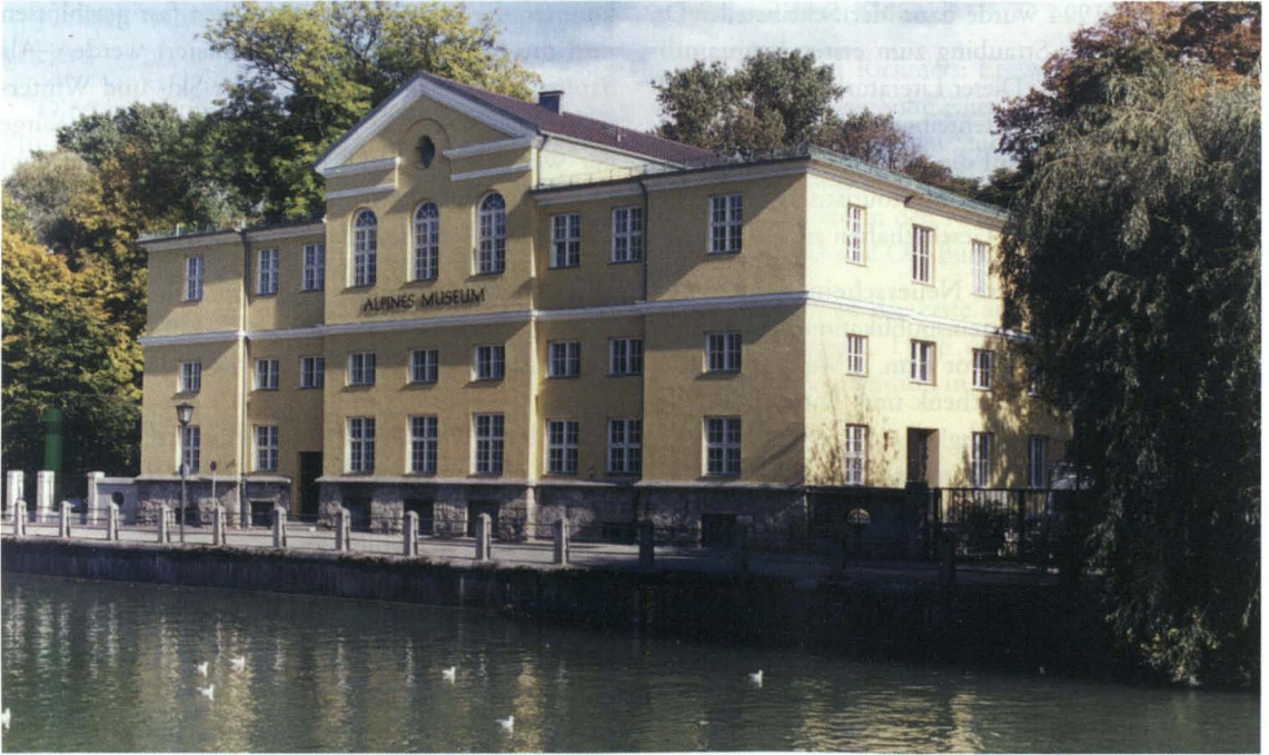
Abb. 1: Haus des Alpinismus auf der Münchner Praterinsel, in dem die Bibliothek des Deutschen Alpenvereins untergebracht ist.

des Gesamtvereins – heute wird dies vom Alpinen Museum verwaltet.