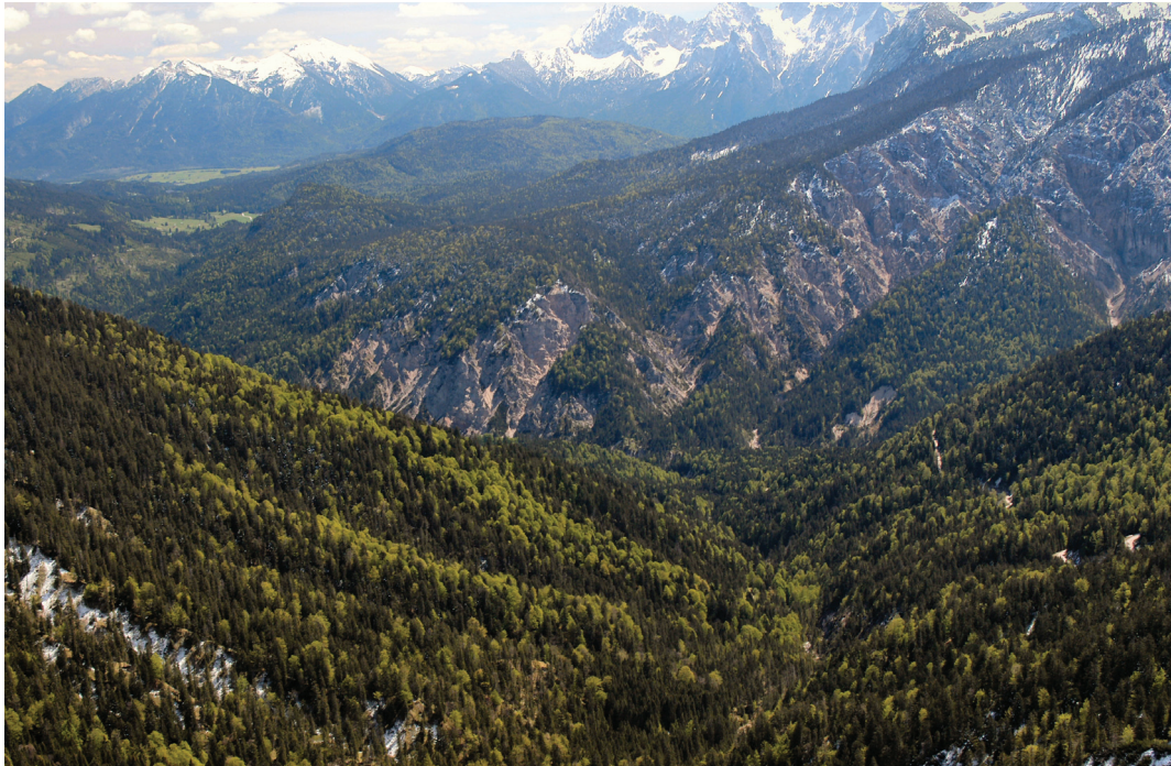
Abb. 3: Bergmischwälder im Bereich des Forstbetriebs Oberammergau.

Die Baumartenzusammensetzung innerhalb der Altersklassen ist ähnlich aufgebaut wie im gesamten Bayerischen Hochgebirge (s.a. Abb. 2). Der Anteil der über 140-jährigen Bestände ist jedoch am Forstbetrieb sehr viel höher und liegt bei rd. 38 %. Im Bereich des ehemaligen Forstamtes Garmisch-Partenkirchen (rd. 12.300 Hektar) umfassen diese alten Wälder sogar rd. 60% der Waldfläche. Dies liegt daran, dass hier die Wälder im Gegensatz zum östlichen Oberbayern nicht durch jahrhundertelange Salinnennutzungen geprägt waren.