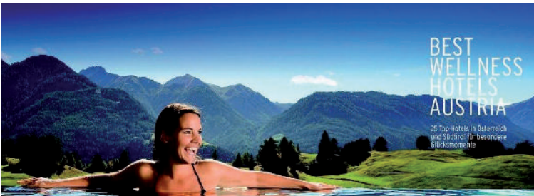
Abb. 3: Das Ideal des neuen alpinen Tourismus: Wellness im Unverfügbaren. (Quelle: SZ vom 6.5.2010).

derne, die Angst vor den ruinösen Folgen früherer Exzesse in den Tälern, die Soft Skills der neuen Generation der Touristiker, dieses Syndrom will dieses Terra incognita aufbrechen.