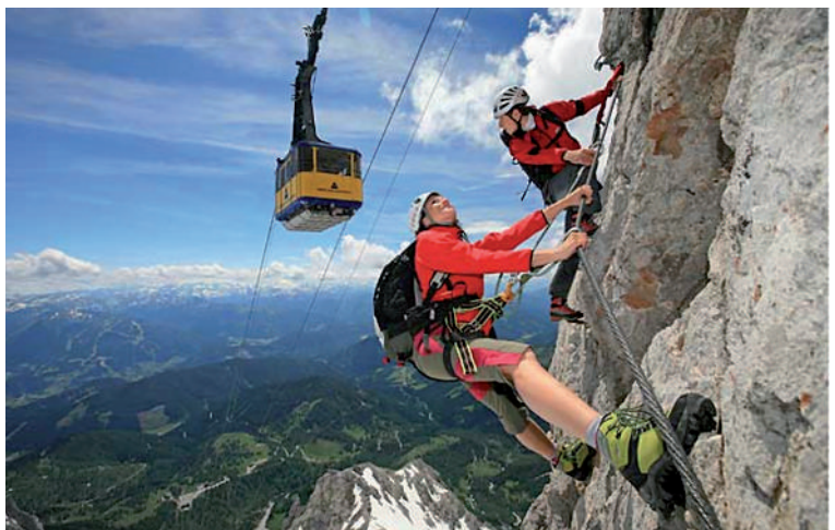
Abb. 6: Der neue Alpinismus, auf der Website von T-ONLINE am 26.8.2011 ganz oben...

Die harten Touristiker hypen noch die Flying Foxes, Alpspixe, Alpine-Coaster – und die bayerischen Politiker standen 2009 & 2011 ganz im Banne der Bewerbung um die Olympischen Winterspiele 2018. Aber das sind Fixierungen auf die bisherigen Formen eines Alpentourismus, der aus dem Prinzip des Vertikalen seinen Profit schlägt: Gaudi, Geschwindigkeit und Schrecken. Wann zerlegt es den