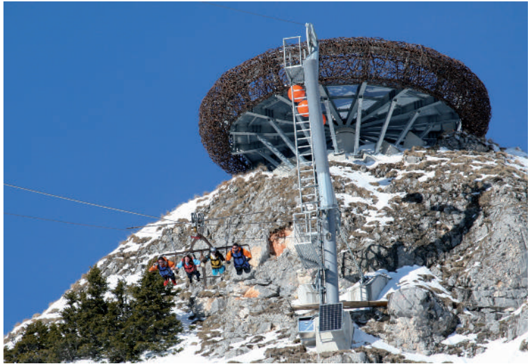
Abb. 5: Aussichtsplattform "Adlerhorst" und Flying Fox, Gschöllkopf 2039 m, Rofan/Tirol. (Foto: P. Weiser).

Grund, Werbung für sich zu machen. Aber die Idee der Vermarktung ist damit auch im Alpenpark Karwendel angekommen – ganz im Sinne des oben bereits erwähnten "Überlebens"-Programmes "Alp Austria".