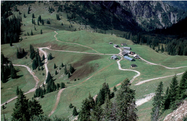
Abb. 4: Güllelandschaft Rotwandalm am Juifen/Alpenpark Karwendel/ Österreich. (Foto: R. Erlacher/Gesellschaft für ökologische Forschung).

Die Signale, dass auch der Naturschutz mit dem ungehobenen touristischen Schatz in den Bergen spekuliert, sind unübersehbar. Ein Beispiel: Im Alpenpark Karwendel, das Tiroler Pendant zum Bayerischen Naturschutzgebiet Karwendel, werden viele Almen den Zielen des Naturschutzes nicht gerecht. Die speziell in Österreich geltende Förderung der auf Almen produzierten Milch hat dazu geführt, dass Hochleistungsmilchkühe auf der Alm gehalten werden, die – wie im Tal – mit Kraftfutter versorgt werden müssen. Damit kommen bis zu 50% des Futters aus dem Tal auf die Alm – ein Energie-Überschuss, der dann nicht als "Kuhdatschi" von der Kuh nach Gusto verteilt, sondern als Gülle vom Almbauern über die Almflächen ausgebracht wird. Dazu werden teilweise eigene Güllewege in die Almflächen trassiert. Die Folge ist ein massiver Artenschwund auf den eigentlich artenreichen "Magerwiesen".