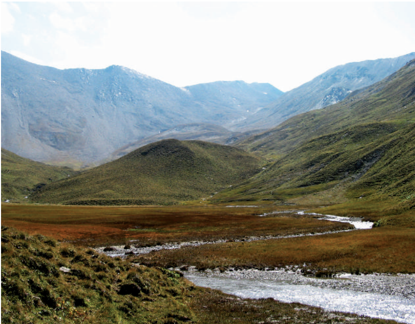
Abb. 2: Moor am Vesilbach. Oben rechts der Gipfelbereich des Piz Val Gronda / Paznaun / Tirol.

Weniger zimperlich geht es im Worst-Case-Szenario "Rotlicht" aus derselben Veröffentlichung zu: "Aufgrund der Wetter-Extreme bricht der Tourismus drastisch ein. Allein der Billig-Tourismus bietet noch eine Existenzgrundlage. Was als Marktsegment übrig bleibt, sind Ballermann-Gäste, Koma-Trinker ("All-Inclusive"). Aber: jede Krise ist auch eine Chance. Zwei arbeitslose Kellner kamen auf die Idee, die Klima-Katastrophen aktiv zu vermarkten: etwa Felsstürze aus der Nähe zu verfolgen (Crash Watching)..."