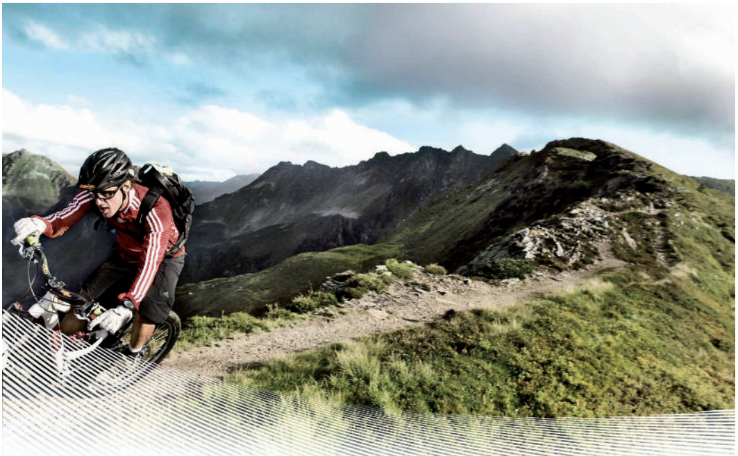
Abb. 7: TIROLWERBUNG auf der Website von T-ONLINE am 7.6.2010: Noch nachhaltig in der "Gegenwelt" unterwegs? Oder schon übers Ziel hinausgeschossen?