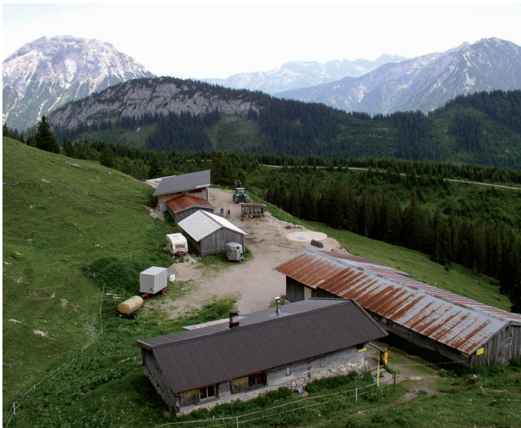
Abb. 4: Die Blaubergalm/Österreich (1540m) auf der Südseite des Blaubergkamms an der Grenze zwischen Bayern und Tirol. (Foto: R. Erlacher, 2011).