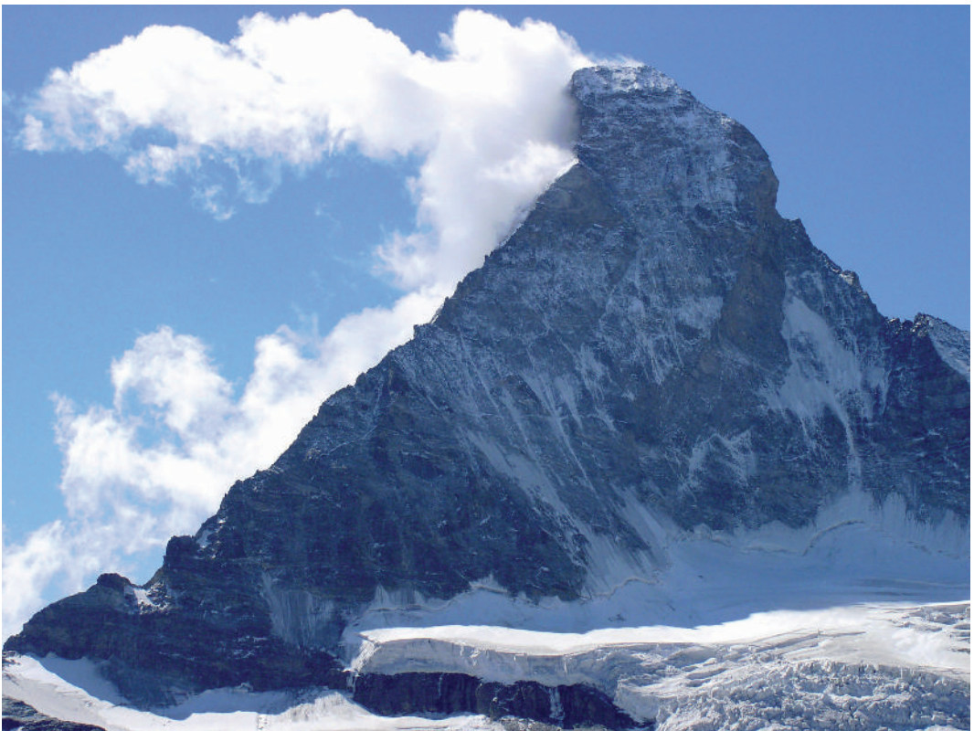
Abb. 1: Das Matterhorn von Norden..

Nicht anders in der Wissenschaft: Schwarze Löcher, die alles verschlucken, Zeitpfeile, die sich umkehren lassen oder auch nicht, Schrödingerkatzen, von denen man nicht weiß, ob sie noch leben! Das alles ist der unergründliche Zauber unserer geistigen Welt, wobei ein "unergründlicher Zauber" eigentlich ein "weißer Schimmel" ist: Jeder wahre Zauber ist unergründlich!