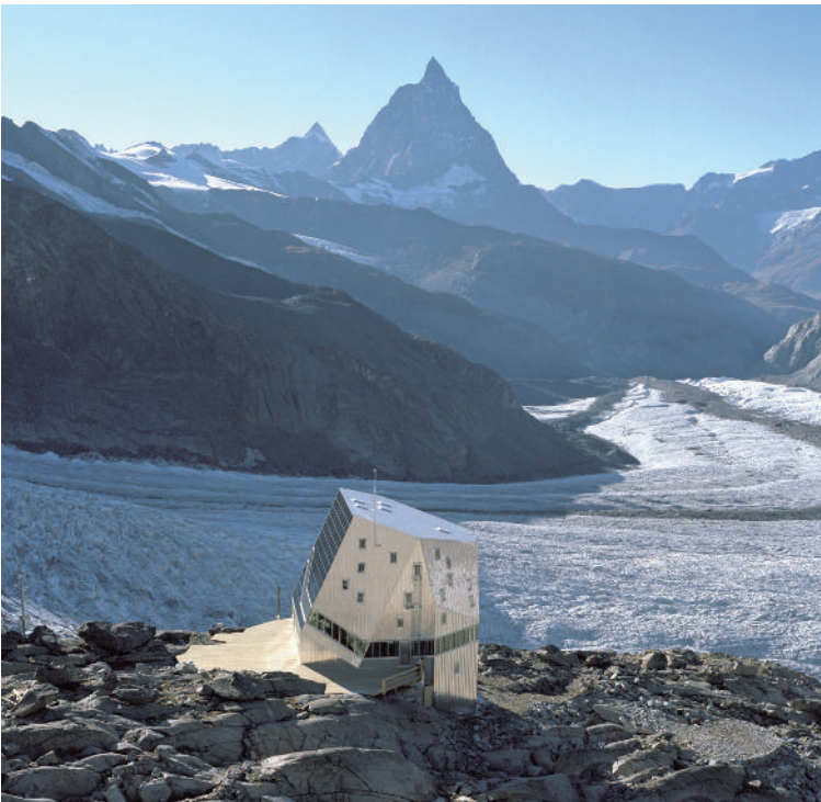
Abb. 5: Die neue Monte-Rosa-Hütte des SAC auf 2883 Meter Seehöhe. Gegenüber das Matterhorn. Die Hütte ist nur mit hochalpiner Ausrüstung erreichbar!