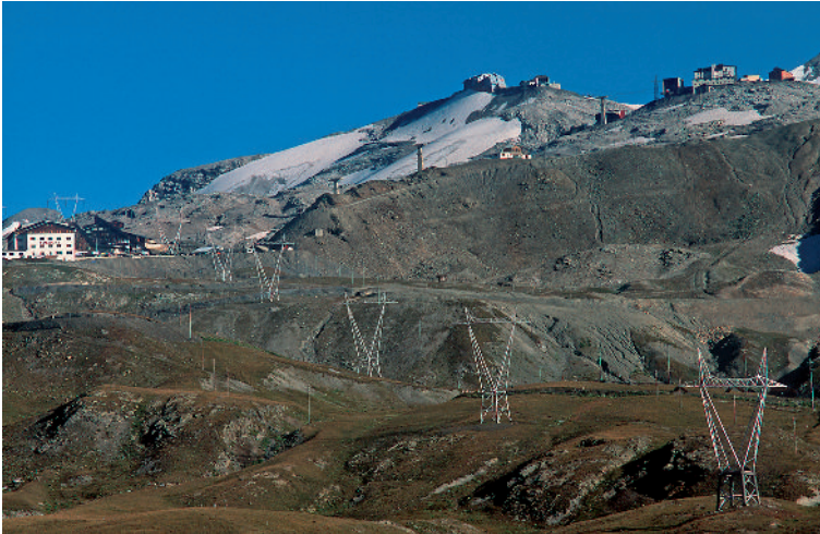
Abb. 3: Verfügte Natur am Stilfser Joch/Italien.

fensiv ein Konzept zur touristischen Nutzung der Almen im Alpenraum. Sie stehen damit in der Kontinuität des Projektes "Alp Austria" 18 , das in einer groß angelegten Evaluierung der Almwirtschaft in Österreich eine dritte ökonomische Säule zur Bestandssicherung vorschlägt: Die authentischen landwirtschaftlichen Einnahmen der Almwirtschaft und die staatlichen Subventionen sollen vom Tourismus flankiert werden. Dieser soll weit über eine einfache Bewirtung der Alm hinausgehen. Das eigentliche wertschöpfende Potential der Alm bestehe darin, die Alm selbst als "Erlebnis" vielfältig zu inszenieren.