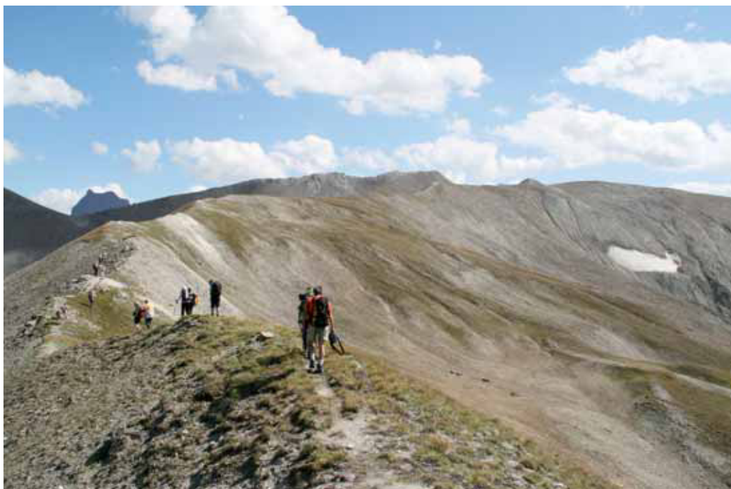
Abb. 1: Vor den 2013 begonnenen Baumaßnahmen war das Gebiet des Piz Val Gronda in Verbindung mit der Heidelberger Hütte für den naturnahen Tourismus ein beliebtes Wandergebiet. Der Blick schweift hier oberhalb des Rumsla Egg (2407 m) über den gesamten Grat Rücken bis zur breiten Gipfelkuppe des Piz Val Gronda (2812 m). Das Gebiet des Piz Val Gronda ist gekennzeichnet als geologisch labiles Gelände (Feinschutthalden) mit Kalkschiefer und Gips, dadurch Vorkommen außergewöhnlich artenreicher und seltener, in Tirol gänzlich geschützter Polsterfluren.

Auf Grund des massiven, nicht ausgleichbaren Eingriffs am Piz Val Gronda in die labile alpine, bisher unverfügte Natur und Landschaft in einem potentiellen Natura 2000-Gebiet wäre das Vorhaben nach europäischem Recht (Beachtung des Verschlechterungsverbots, der zwingenden Erheblichkeitsprüfung in einem FFH-Gebiet und nach der Vorwirkungsrechtsprechung des EuGH, bei ausreichender Öffentlichkeitsbeteiligung in Umweltangelegenheiten, bei ausreichender Anpassung des Tiroler Jagdgesetzes an die Vogelschutzrichtlinie) sowie aus Gründen der Festlegungen der Alpenkonventionsprotokolle unseres Erachtens nicht genehmigungsfähig gewesen.