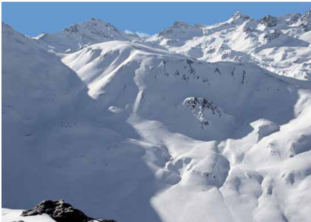
Abb. 2: Das Gebiet des Piz Val Gronda nahe der Schweizer Grenze in der Samnaungruppe (Tirol) vor den 2013 begonnenen Baumaßnahmen zur weiteren skitechnischen Erschließung des Skigebietes Ischgl.

Am 8. Mai 2013 veröffentlichte der OeAV die Meldung: "Entscheidung über die Erschließung des Piz Val Gronda/Ischgl ist gefallen. Vorerst!", die auch auf der Homepage des Vereins zum Schutz der Bergwelt veröffentlicht wurde: