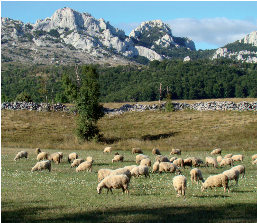
Abb. 7: Landschaftspflege durch Schafbeweidung in den Dinarischen Alpen.