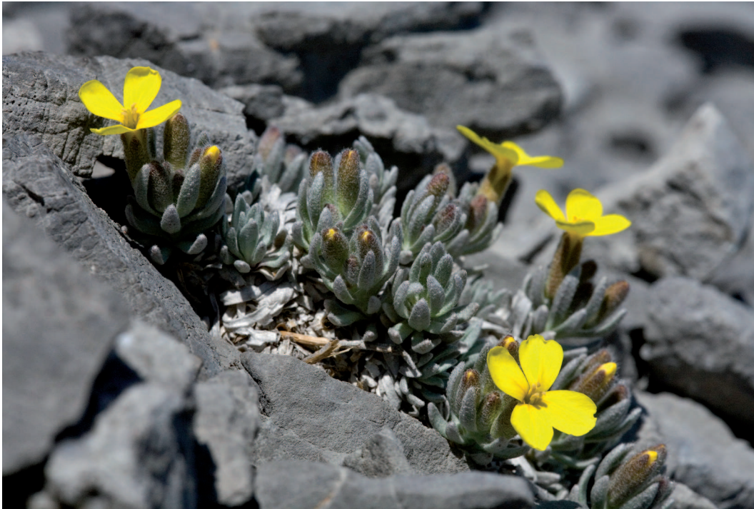
Abb. 4: Die Velebit-Degenie ( Degenia velebica ), eine Primelart, zählt zu den gefährdetsten Arten Europas und weltweit. (Foto: Boris Krstinic).

Hinsichtlich der Lebensräume wurden folgende Ergänzungen vorgeschlagen: Tuff-Kaskaden der Karstflüsse im Dinarischen Gebirge (Code: 32A0) und Submediterranes Grünland des Molinio-Hordeion secalini (Code: 6540). Zusätzlich gilt es einer Überarbeitung eines bestehenden Lebensraumes: Schutthalden im östlichen Mittelmeerraum (Code: 8140) (EUROPEAN COMMISSION 2013).