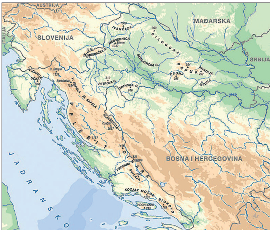
Abb. 1: Das Staatsgebiet Kroatiens.

Der Alpenraum ist in seiner Vielfalt besonders interessant. Das geschützte Gebirge des Dinarischen Bogens, die Kalktuff-Kaskaden der Karstflüsse sowie zahlreiche Höhlen beherbergen Lebensräume für unzählige gefährdete Arten. Eine herausragende Bedeutung im alpinen Raum sind die Lebensraumbedingungen der weitgehend unerschlossenen Waldflächen im Westen bzw. wenig besiedelter großflächiger Graslandschaften im Süden des Landes. Sie ermöglichen das Überleben vieler Säugetierarten, unter anderem des Braunbären, Luchs und Wolfs sowie 34 verschiedener Fledermausarten. Seit Jahren engagiert sich Kroatien unter Beteiligung der Europäischen Kommission um innovative Schutzmaßnahmen für die Bären- und Wolfpopulation (STATE INSTITUTE FOR NATURE PROTECTION, 2005). Neben der Fragmentierung des Lebensraums sind vor allem Jagd und Wilderei der größte Druck auf diese Arten.