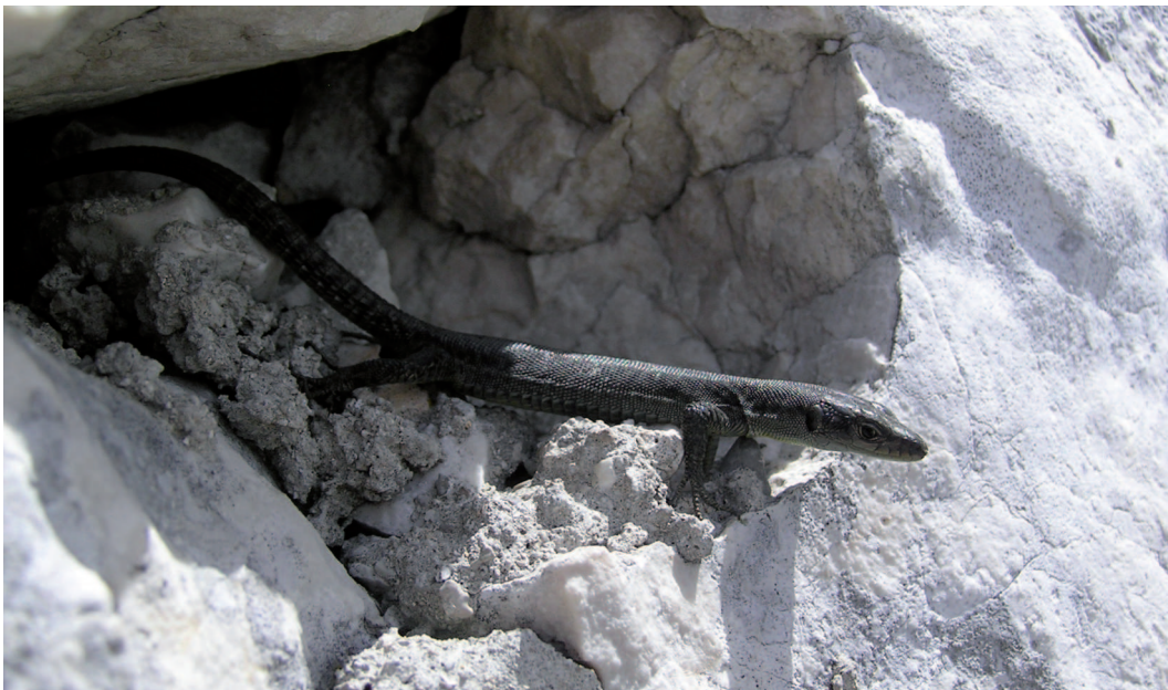
Abb. 3: Die seltene Mosor-Gebirgseidechse ( Dinarolacerta mosorensis ) – ihr Lebensraum: feuchte Gebiete in den Dinarischen Alpen.