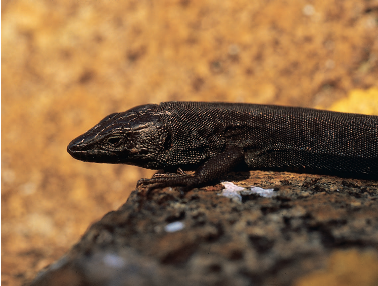
Abb. 9: Die Adriatische Mauereidechse ( Podarcis melisellenis ) lebt auf den alpinen, wenig bestockten Karstflächen bis zu 1300 Meter.