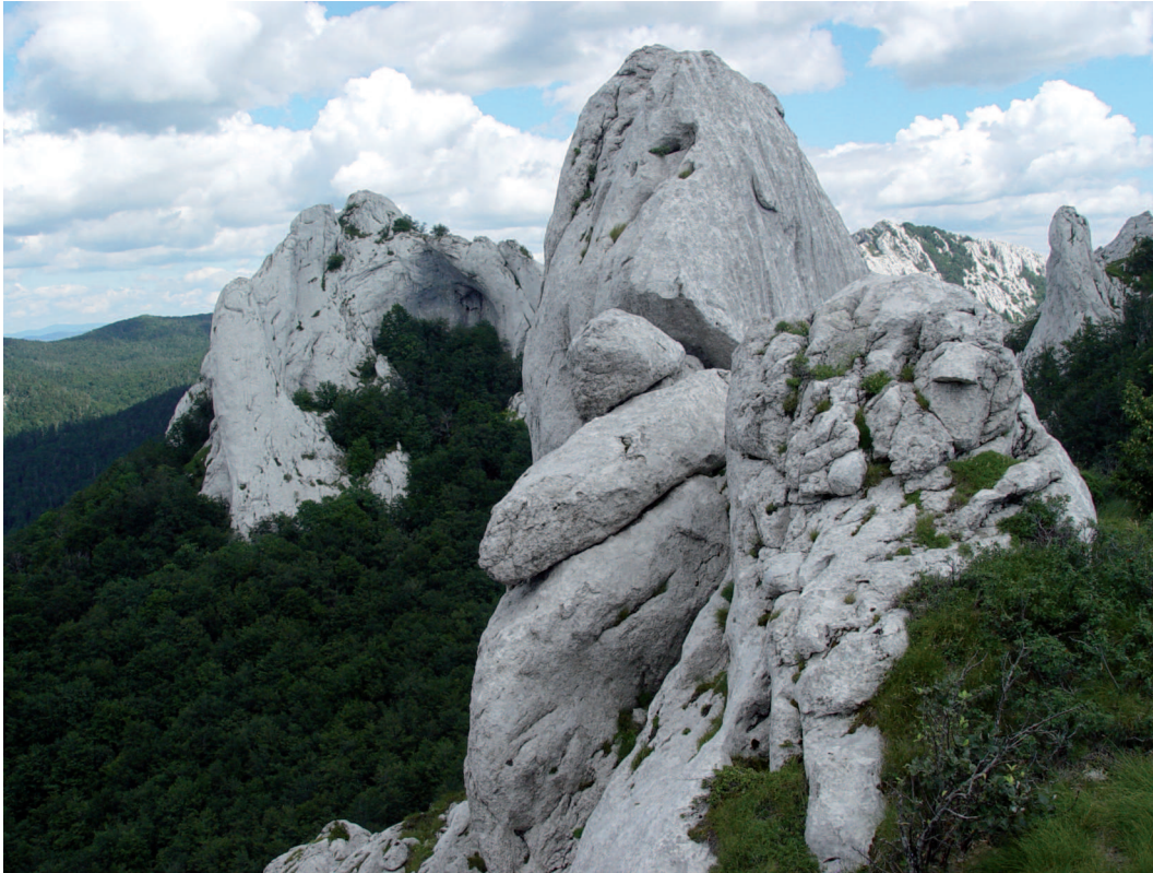
Abb. 5: Karsterscheinung der Dinarischen Alpen.

sonderheiten geprägt. Der Wasserhaushalt im Karst ist extrem kompliziert, teilweise nur sehr schwierig und aufwendig erforschbar und dementsprechend sensibel betreffend allfälliger anthropogener Wirkungen. Golfplätze, Skipisten, Güterwegebau oder Hotelanlagen können in diesen Gebieten zu schwer bis nicht kalkulierbaren Folgen führen.