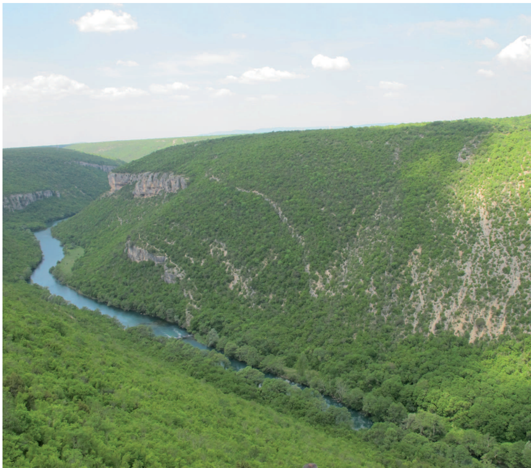
Abb. 8: Canyon des Krka-Flusses.

Die Alpenregion in Kroatien besitzt jedoch ein großes Potenzial für ländliche Entwicklung. Während die Inselwelt Kroatiens und die Küste für Millionen Touristen bekannt und beliebt sind, ist das Inland mit seinen Wäldern, weiten Graslandschaften, atemberaubenden Canyons und den bizarren Felsformationen des Velebit weitgehend unbekannt. Die Förderung der Regionalentwicklung z.B. durch LEADER-Projekte oder andere Initiativen könnte einer der wichtigsten Grundlagen zur Erhaltung der biologischen Vielfalt in den alpinen Natura 2000-Gebieten darstellen.