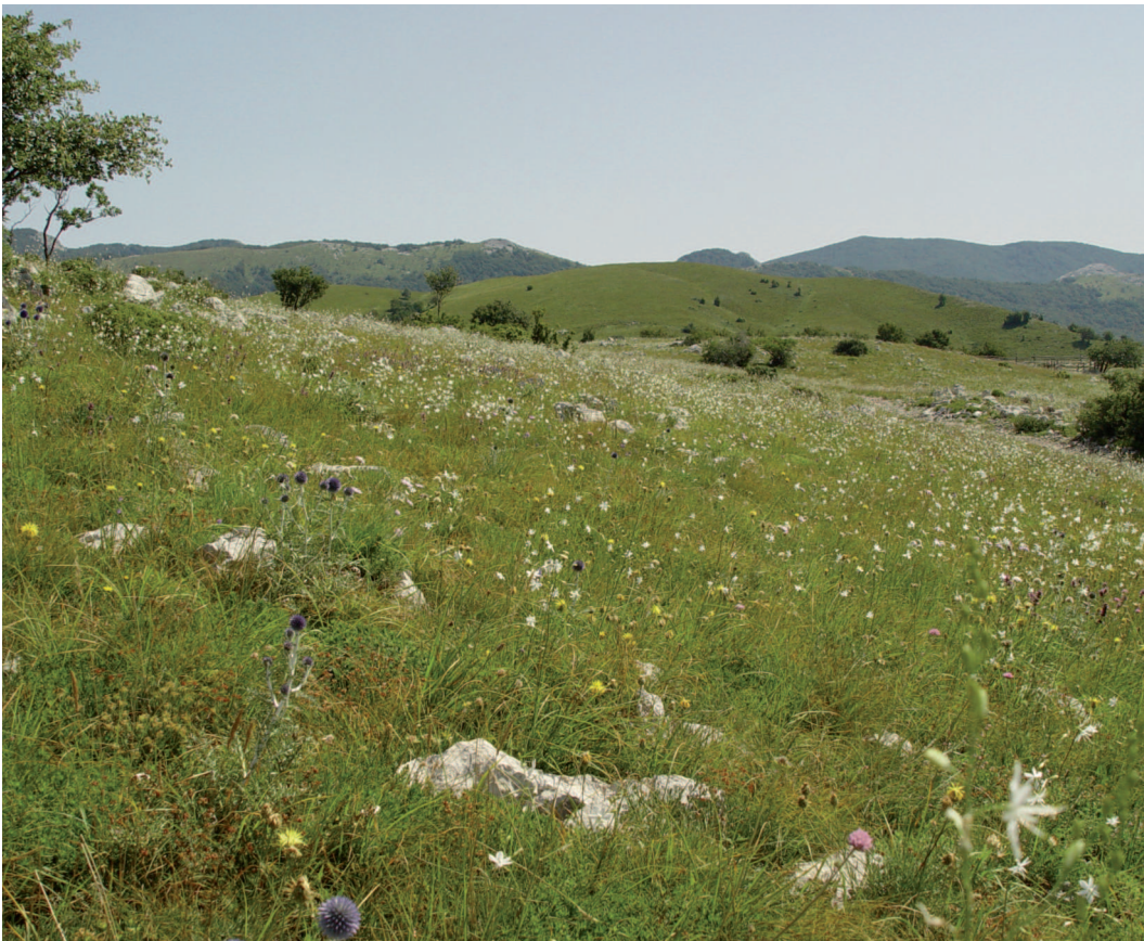
Abb. 10: Weite, bisher extensiv beweidete Trockenrasenlandschaften (hier bei Obruč nahe dem Nationalpark Risnjak) prägen den Karst Kroatiens – durch zahlreiche Betriebsaufgaben sind diese Lebensräume akut gefährdet.