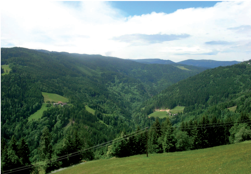
Abb. 2: Das Tal der Schwarzen Sulm – Laubgehölze sind fast nur mehr am Unterhang zu finden, im Hintergrund die Koralpe/Steiermark.

In den engen Kerbtalbereichen der Schwarzen Sulm mit ihrer teilweise extrem schwierigen Zugänglichkeit blieb abschnittsweise ein Mosaik aus mehr oder weniger ursprünglich erhalten gebliebenen Lebensräumen bestehen. Hier herrschen aufgrund der kleinräumig wechselnden Standortverhältnisse ausgesprochen abwechslungsreiche Vegetationsverhältnisse vor. Auf schmale und tiefe Schluchtstrecken folgen bisweilen kleinflächige Verebnungen und dann wieder kataraktartige Abbrüche sowie Einengungen durch anstehendes Gestein, meist steil aufragende Plattengneise. Der Wasserlauf variiert von unter zwei Metern Breite mit bis über drei Meter tiefen Kolken bis hin zu zehn Meter breiten Abschnitten mit Wassertiefen im Dezimeter-Bereich.