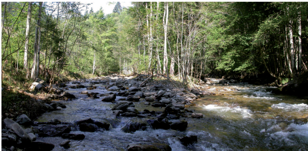
Abb. 8: Furkationsstrecke unterhalb der Einmündung des Seebaches mit breiteren Grau-Erlen-Aubeständen.