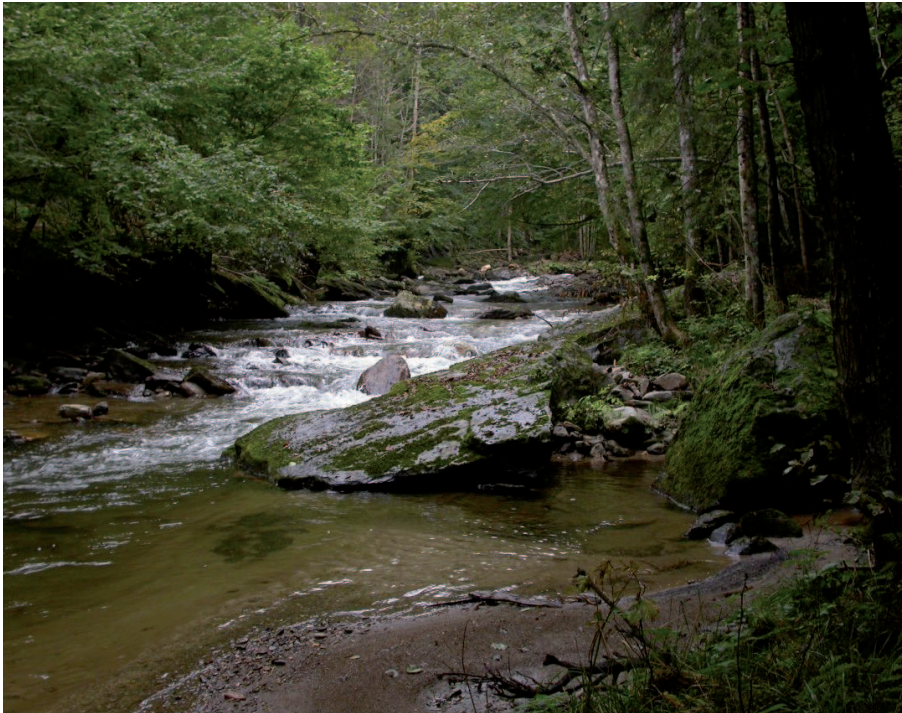
Abb. 3: Typische Ansicht der Schwarzen Sulm am unteren Ende der Schluchtstrecke nahe dem Austritt aus dem Randgebirge.