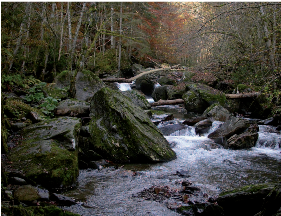
Abb. 4: Abwechslungsreiche Katarakt- und Ruhigwasserstrecke, Verzahnung von Hang-, Schlucht- und Auwaldbereichen am blockigen Ufer.