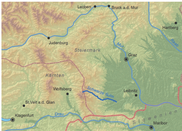
Abb. 1: Lage der Schwarzen Sulm am Südost-Rand der Alpen in der Steiermark (Datengrundlagen: srtm.csi.cgiar.org, natural earth data, GIS-Steiermark).

mit ist in dieser Region das Waldbild stark von anthropogenen Einflüssen überprägt und naturnahe Laubmischwälder der montanen Höhenstufe mussten Fichten-Ersatzgesellschaften weichen.