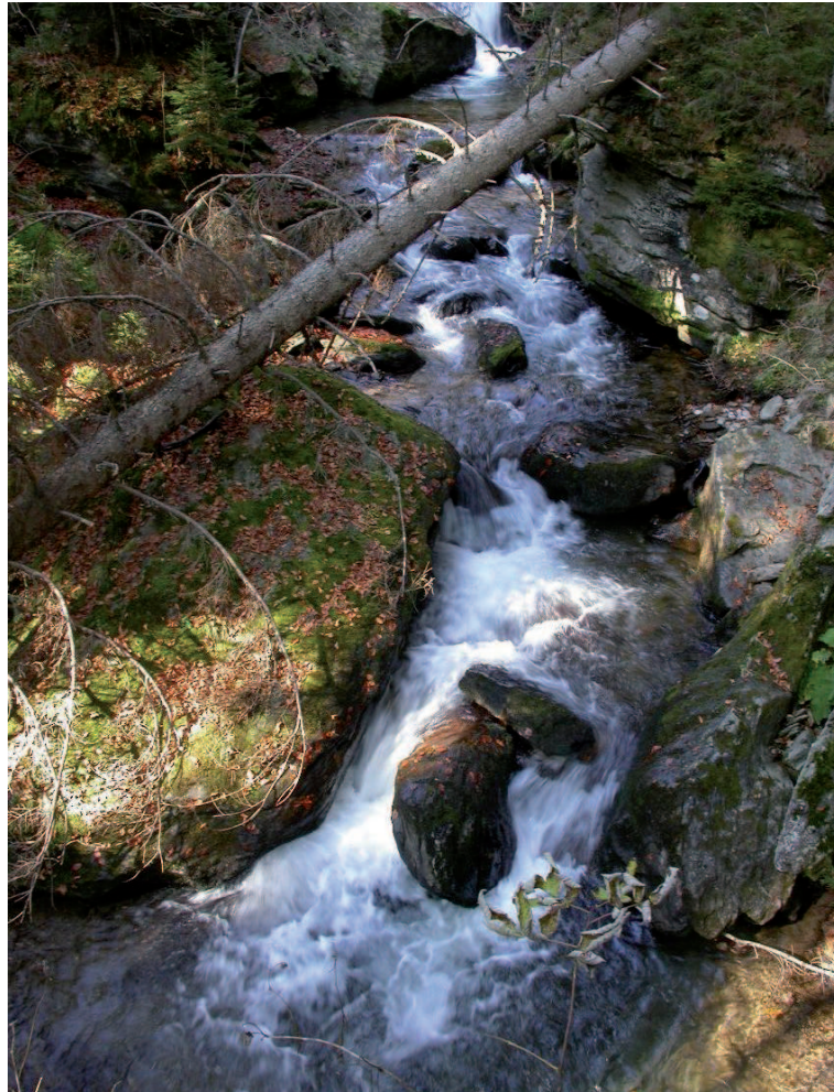
Abb. 7: Wilde und laut tosende Kataraktstrecke in engem Schluchtabschnitt.