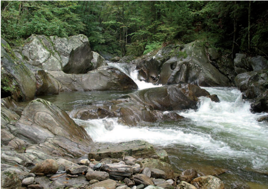
Abb. 9: Die Macht der Schwarzen Sulm über Jahrhunderte – ausgekolkter und geschliffener Gneis.