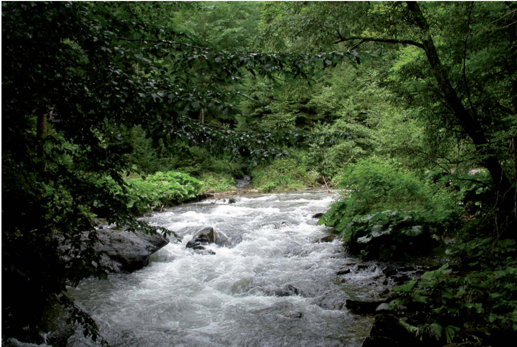
Abb. 5: Kleinflächige Sedimentauflandungen werden von dichten Pestwurzfluren bewachsen.