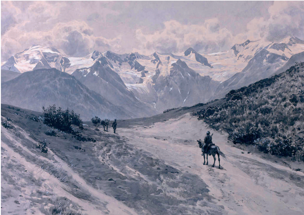
Abb. 7: Blick auf die ca. 30 km vom Latparipass entfernte Lailakette, "vom Wege über den Bergsattel oberhalb Betscho (Kaukasus, Swanetien). Nach der Natur gezeichnet von Ernst Platz" (1904; Ausschnitt aus dem Original; Archiv des Deutschen Alpenvereins, München).