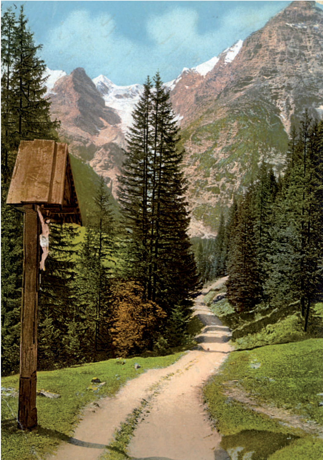
Abb. 11: Wanderweg in Südtirol, mit Ortler. Thereses letzte Berg-Erfahrung 1921, mit über 70 Jahren (Ansichtskarte um 1900).