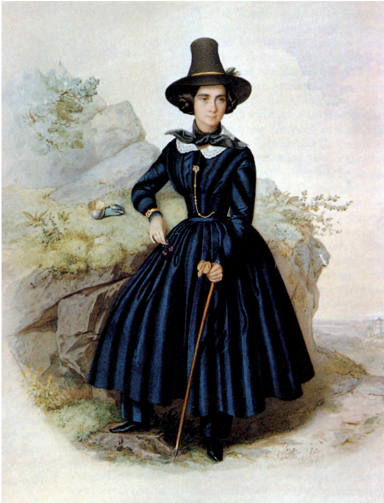
Abb. 4: Kronprinzessin Marie, die spätere Königin, in dem von ihr entworfenen Berg-Kostüm ihres Achsel-Alpenrosen-Ordens, im Hintergrund rechts unten Schloss Hohenschwangau; Galvanografie von Leo Schöninger, 1844 (Geheimes Hausarchiv, München).