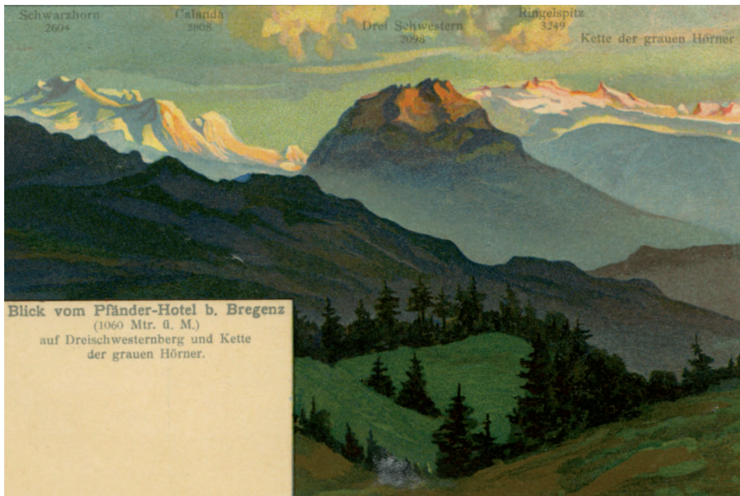
Abb. 3: Blick vom Pfänder auf Dreischwesternberg und Kette der Grauen Hörner (Ansichtskarte um 1900).

ner Weise gegen 4 braucht. 13 Der Ausflug war als Vorübung zur Besteigung des Dreischwesternberges [2053 m] geplant, zu welchemzuletzt es aber erst genau 40 Jahre später, u. zwar ohne Vorübungen, kommen sollte. 1880 wird das Hochäpple (1460 m) bestiegen. Das Fazit dieser und zahlreicher weiterer Fuß- und Reitausflüge nach Vorarlberg: Dort packte mich wieder mächtig die ganze Großartigkeit der Gebirgswelt. 14