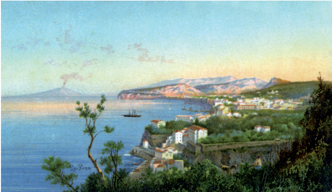
Abb. 6: Blick von Sorrent über den Golf von Neapel zum Vesuv (Ansichtskarte um 1900).