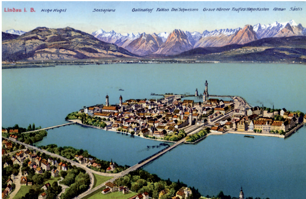
Abb. 2: Lindau mit seiner Bergkulisse aus der Vogelperspektive (Ansichtskarte, Motiv um 1910).

Häufigster Ausgangspunkt für Bergtouren in Europa ist ihr lebenslanges heißgeliebtes Refugium in Lindau am Bodensee, in dem sie jedes Jahr die Sommer- und Frühherbstmonate verbringt. Dort erholt sie sich von dem eingeschränkteren höfischen Leben in München, von den dort unumgänglichen prinziplichen Repräsentationsaufgaben, den Kindespflichten gegenüber ihrem verwitweten Vater. Hier, in der von der Mutter erworbenen Villa "AmSee", kann sie sich – entspannt und konzentriert zugleich – ihrem Lebensziel widmen: Forschen, Reisen, Schreiben. Als 1914 bei Ausbruch des "großen Krieges" ihre vehemente Antikriegshaltung in München publik wird und dort Bemerkungen fallen wie "so eine gehöre eingesperrt", beschließt sie, ganz in Lindau zu bleiben. Von dort aus erklimmt sie nach und nach alle einschlägigen Berge südlich des Bodensees. Ungeachtet staatlicher Grenzen und offensichtlich ohne hinderliche Grenzprobleme wandert sie in Deutschland, der Schweiz, Österreich, Liechtenstein und Südtirol.