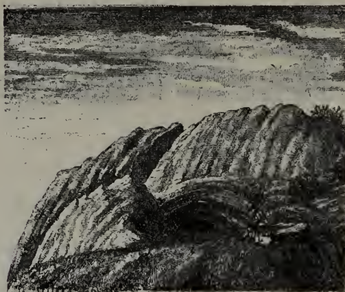
Das „Schottloch“ auf dem Kufstein.

Besserer Lohn wurde mir im sogenannten „Schottloch“, welches nahe unter dem Gipfel des „Kufsteines“ 1) , ungefähr zwischen der Starnalpe und den Grafenbergerseen in einer niedrigen Wand liegt. Der Zugang ist nicht schwierig, dagegen kann man nur kriechend in die Höhle gelangen, deren erster, gangartiger Theil mit grobem Schutte so weit ausgefüllt ist, dass bis zur Decke nur mehr ein Raum von