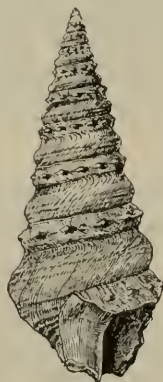
Pleurotoma Neudorfensis nov. spec.