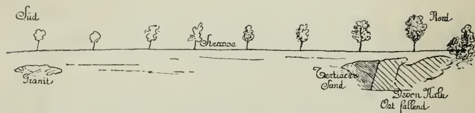
Fig. 2. Aufschlüsse an der Straße unterhalb des Kleidovka-Wirtshauses.

In der Umgebung von Lösch sind die Grenzen von Kalm und Devon gegen den Granit teils durch eine mächtige Lößdecke, teils durch miocäne Sande und Schotter verdeckt. Letztere sind sehr verbreitet auf den Höhen und in den Gräben zwischen Lösch und dem Mordowa-Meierhofe und finden sich in Form kleiner Erosionsreste wiederholt auf dem Granitgebiete im Westen der Straße. Wie fast im ganzen Miocängebiete der Umgebung von Brünn gehören auch hier zum wesentlichen Bestande der Sande und Schotter zahlreiche Trümmer