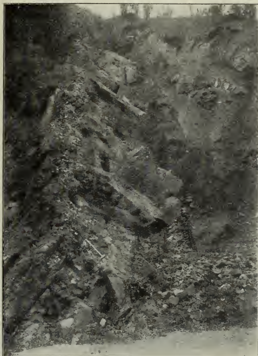
Fig. 5. Bänke von Sandstein und Konglomerat des Kulm an der Straße unterhalb Lösch, in fast senkrechter Stellung.

In den Tälern sind die Konglomerate fast allenthalben gut aufgeschlossen, so besonders an der Straße von Lösch zum Rziczkatale und im Durchbruche bei Schlapanitz, bei Wellatitz, am Napoleons-