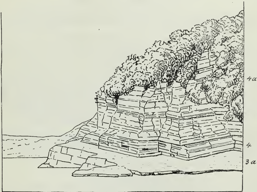
Kalke mit Stephanoceren ; überlagert von Posidoniengesteinen im Norden der Insel Vido.

3. Dünnebankte, helle Kalke mit knolliger Oberfläche, gegen oben zu kieselig. Aus der obersten Bank (3a) Stephanoceras aff. longalvum Vacek 3) und Phylloceras cf. disputabile Zittel. (Siehe Fig. 4.)