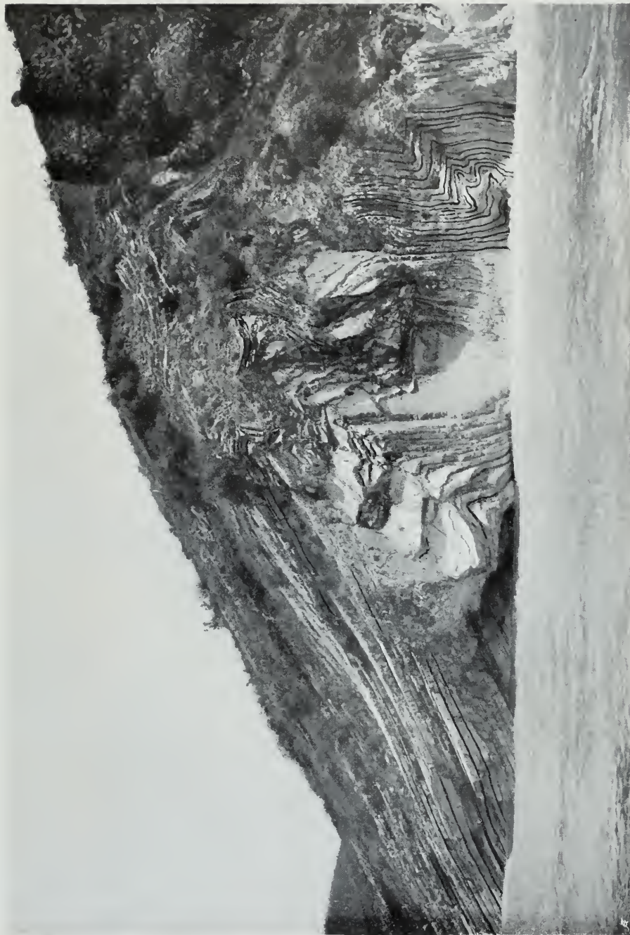
Epirus: Gefalteter Plattenkalk nordöstlich vom Kap südl. San Giorgio.