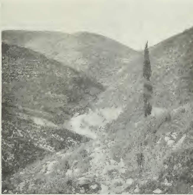
Palaeospita auf Korfu von W.

Ammoniten- 2) und Posidonienschichten und ein zweitesmal unmittelbar bei den Häusern Vligatzuri (oberhalb Glypha). Hier liegen die Zisternen in den liassischen Posidonienschiefeln.