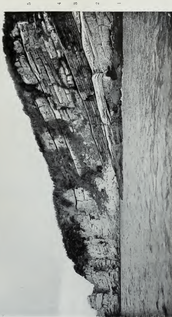
Epirus: Kap südlich des Klosters San Giorgio (Punta rossa).

Durchschnitt durch den oberen Lias und unteren Dogger (vergl. pag. 746 [2]).