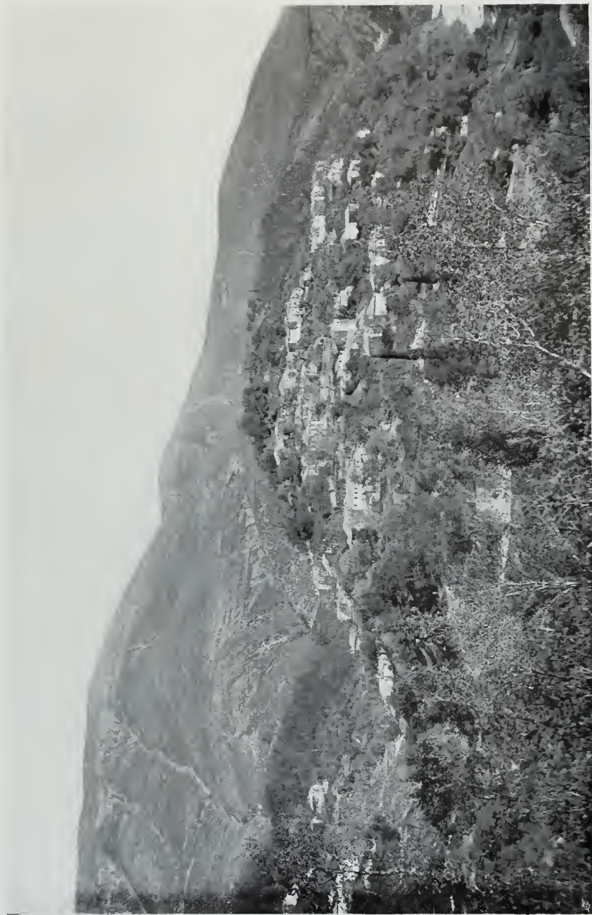
Epirus: Dorf Muzina am Westabfall der Platovmit.

Posidoniengesteine (vergl. pag. 757 [13]).