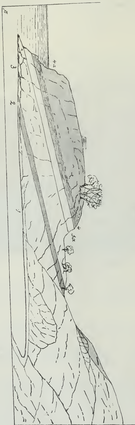
Profil im Norden der Insel Vido.