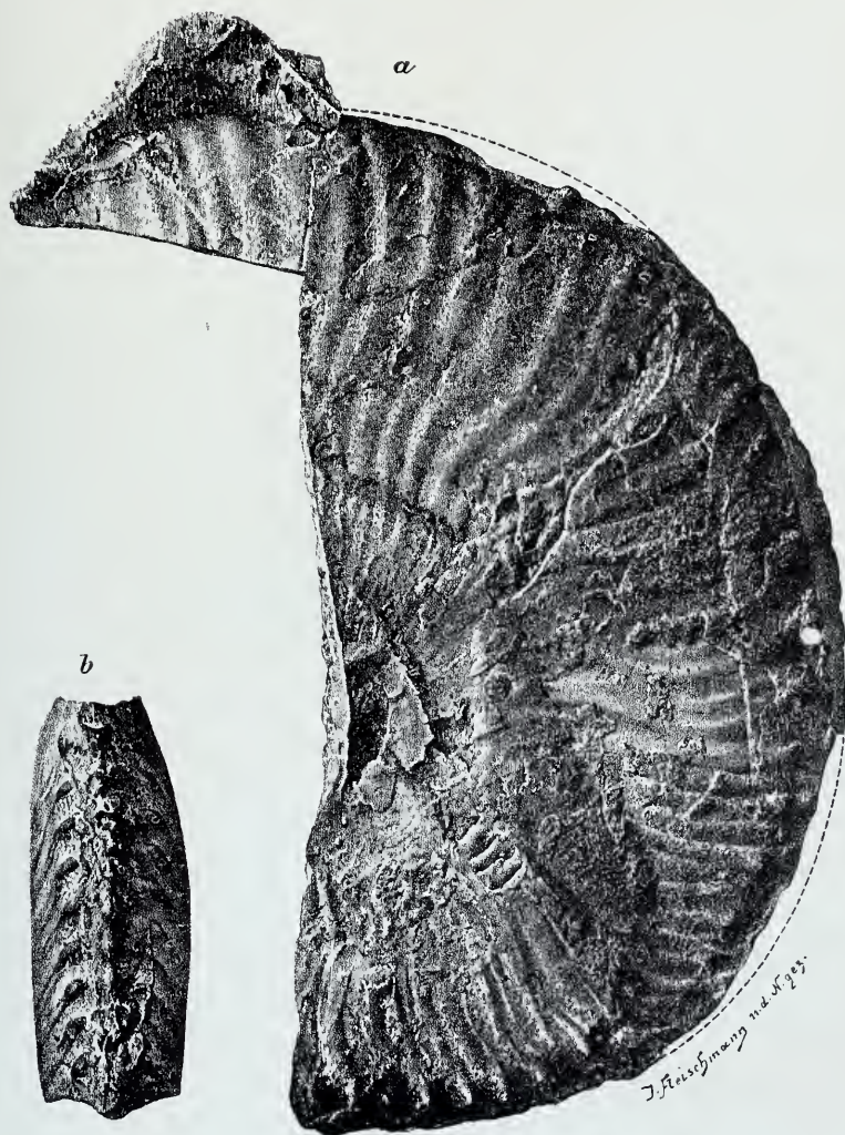
Oppelia dinarica nov. spec.