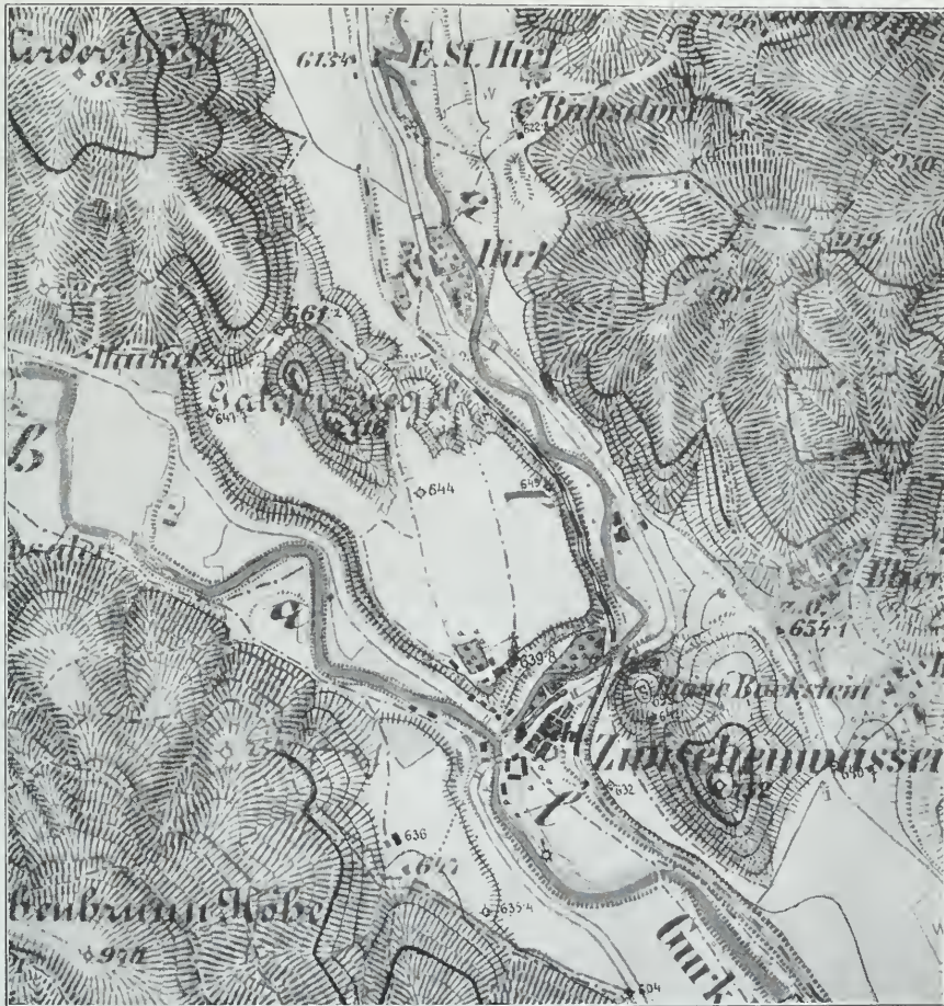
Ausschnitt aus der Sektionskopie Zone 18, Kol. XI NW im Maßstabe 1:25.000.