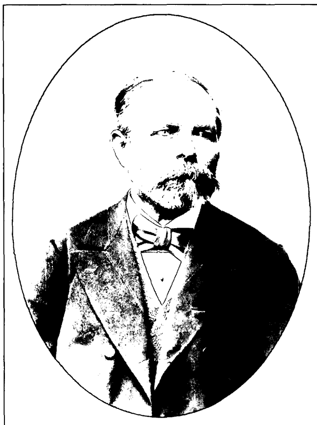
Abb. 1. Porträt von HEINRICH WOLF (1825–1882), Geologe an der Geologischen Reichsanstalt.

Im Rahmen der Zusammenarbeit zwischen der Geologischen Bundesanstalt in Wien und des Tschechischen Geologischen Dienstes (Česky geologický ústav) wurde ein Vorhaben in Angriff genommen, um das kartographische Material an der Geologischen Bundesanstalt zu sichten. Im Rahmen dieses Vorhabens wurde das kartographische Material aus dem Blickwinkel moderner geologischer Forschung im Gebiet von Böhmen, Mähren und Österreichisch Schlesien ausgewertet. Das Vorhaben wurde 1989 begonnen und die Arbeiten in den Folgejahren weiter geführt.