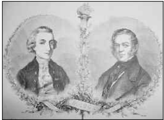
Abb. 1. Carl Maria HAIDINGER (links, 1756–1797) mit seinem Sohn Wilhelm HAIDINGER (rechts), dem Gründungsdirektor der Geologischen Bundesanstalt.

Noch im gleichen Jahr publizierte er die Arbeit bei den „Einträchtigen Freunden in Wien“ und übermittelte das Manuskript Abraham Gottlob WERNER in Freiberg, der dort seit 1775 Professor für Bergbaukunst an der Bergakademie war und im deutschsprachigen Raum auf Grund seiner 1774 in Leipzig erschienenen Arbeit „Von den äußerlichen Kennzeichen der Fossilien“ als eine Koryphäe der „Mineralogie“ angesehen wurde. Der Titel ist für heute insofern irreführend, als damals unter „Fossilien“ vor allem Mineralien verstanden wurden. WERNER stützte sich hierbei auf ihre verschiedenen Merkmale, also Farbe, Glanz, Gestalt, Schwere usw. Im Jahre 1885 erschien das über 230 Seiten dicke Buch in einer zweiten Auflage in Wien. Bis zu diesem Zeitpunkt gab es jedoch keine Klassifikation der „Gebirgsarten“, d.h. der Gesteine. Möglicherweise war dies der Grund, weswegen HAIDINGER WERNER seine Gliederung