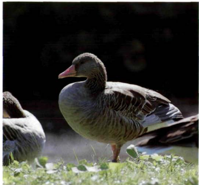
Abb. 48: Graugänse

Für Gänse ist in Österreich zweifellos das Neusiedlersee-Gebiet der wichtigste Durchzugs- und Rastplatz. Andere Gebiete, wie zum Beispiel die Donau, spielen zwar zeitlich und lokal beschränkt auch eine gewisse Rolle, sind aber mengenmäßig für Enten und Taucher weitaus mehr von Bedeutung (Aubrecht & Böck 1985). Im Zusammenhang mit dem mitteleuropäischen Raum müssen für die Gänse zwei Hauptzugwege unterschieden werden. Der nördliche führt vom Baltikum nach Norddeutschland und Holland und für die westliche Rasse der Graugans weiter ins Coto Doñana-Gebiet in Spanien (Abb. 46). Der östliche Weg geht von Ostdeutschland über die Tschechoslowakei nach Österreich und dann nach Arten verschieden weiter nach Südosten beziehungsweise nach Nordafrika. Zahlenmäßig ist die Saatgans ( Anser fabalis ) am stärksten vertreten (vgl. Tab.), und ihre Höchstbestände haben sich auch seit 1948 kaum verändert (zwischen 6000 und 35.000, meist um 20.000 Exemplare). Die Saatgans trifft nach der Graugans ungefähr Ende Oktober/Anfang November im Seewinkel ein. Die hier durchziehenden Saatgänse sind der Rasse Anser fabalis rossicus zuzuordnen, die in den Tundren an der arktischen Küste Westsibiriens brütet und im Gegensatz zu der Wald-Saatgans ( Anser f. fabalis ) erstens kleiner ist und zweitens einen schwarzen Schnabel mit nur schmaler gelben Binde besitzt.