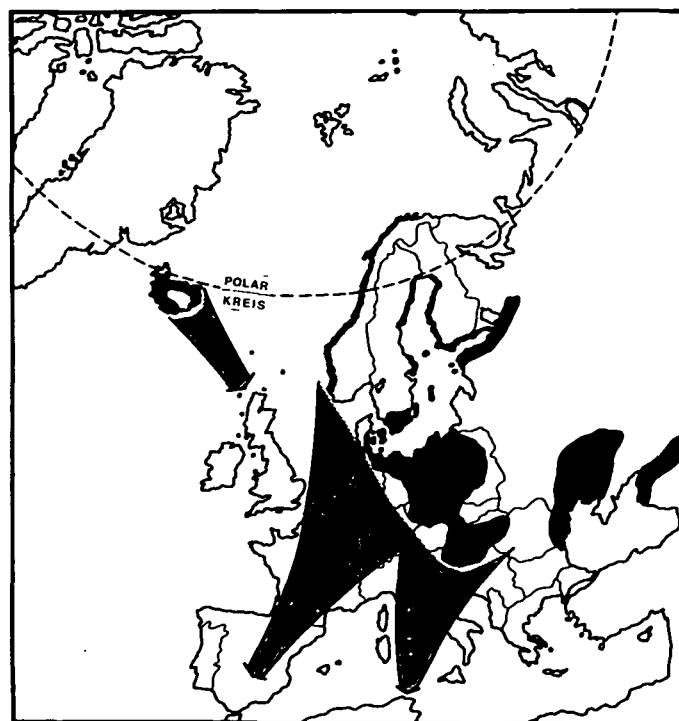
Abb. 47: Graugans — Brut- und Überwinterungsgebiete und Zugstraßen (aus Owen et al. 1986)

Abb. 46 (links): Darstellung der im Text erwähnten Gebiete sowie Beobachtungs- und Wiederfundorte österreichischer Graugänse