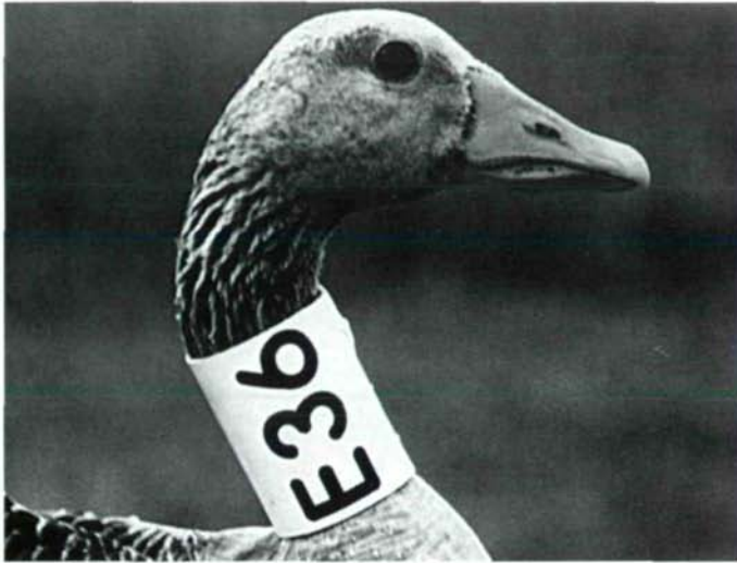
Abb. 49: Am 8. Juni 1984 am Kirchsee bei Illmitz (Seewinkel) mit Halsmanschette beringte Graugäns; die Zahl ist rel. einfach auch mit Fernglas ablesbar.

die Brutvögel kehren nach einem außergewöhnlichen sommerlichen Zwischenzug in die Tschechoslowakei Ende September wieder nach Österreich zurück (Dick et al. 1984), bereits zusammen mit den tschechischen Graugänsen. Die Höchstbestände betragen dann meist ungefähr 6000 Exemplare. Wie Beobachtungen von mit Halsmanschetten be-