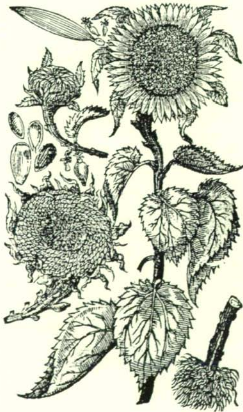
Groß Indianisch Flos Solis Peruvianus. Sonnenblum.