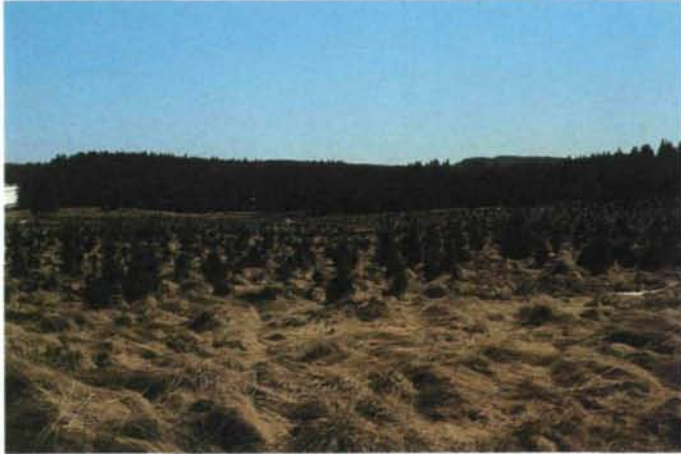
Abb. 21: Durch Fichtenaufforstung werden oft wertvolle Wiesenflächen zerstört.

zung aus jetzt noch naturnahen Wirtschaftswäldern naturferne Wälder und aus letzteren Kunstforste mit allen begleitenden floristischen, faunistischen und synökologischen Verarmungseffekten machen. Maßnahmen wie Waldkalkung und Walddüngung sind als Teilbeiträge zur Bekämpfung des Waldsterbens so gut wie unerprobt. Es gibt guten Grund zur Annahme, daß es sich dabei weitgehend um Symptomkuren handelt, deren Langzeitwirkungen vorerst weder im positiven Sinne noch hinsichtlich der möglichen und auch zu erwartenden Negativfolgen gar nicht beurteilt werden können. Außerhalb sorgfältig und langfristig begleitend ökologisch kontrollierter Versuchsflächen haben sie entsprechend noch keinen Platz.