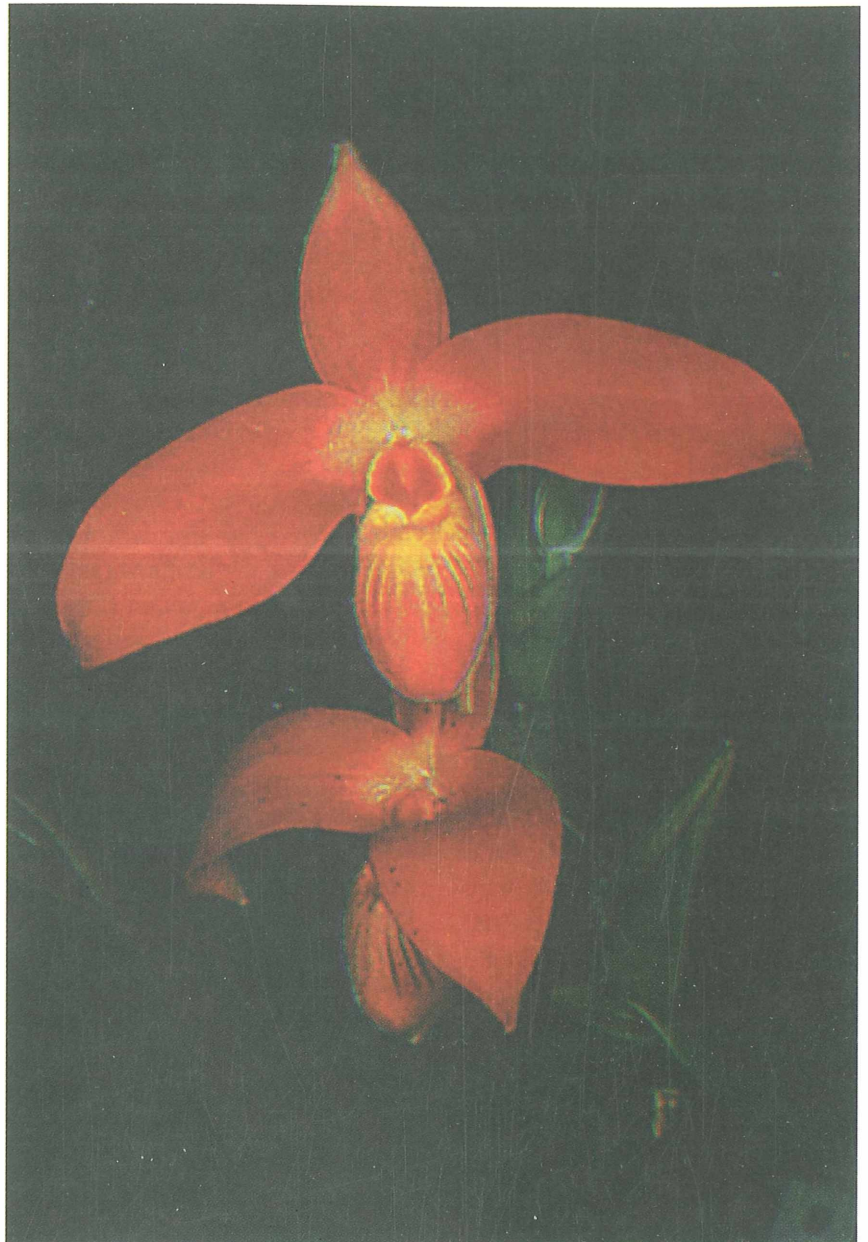
Abb. 2: Obwohl es über 20.000 Orchideenarten und zwischenzeitlich eine Unzahl schön blühender und einfach zu haltender Hybridarten gibt, sind Liebhaber nach wie vor bereit, für seltene (meist endemische) Arten bis zu 3000 Dollar zu zahlen, wie z. B. für die erst 1981 als neue Art beschriebene Phragmipedium besseae . (aus: BURTON 1994).