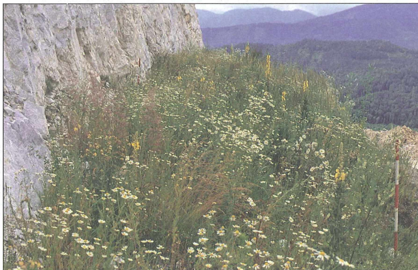
Abb. 1: Bermen mit Sukzessionsbereichen.

Die Erhebungen im Kärntner Steinbruch bei Puch/Gummern erbrachten 373 Pflanzenarten, darunter 24 gefährdete Pflanzenarten (Tab. 1) nach der Roten Liste Österreichs (NIKLFIELD 1999) sowie 16 nach der Roten Liste Kärntens (KNIELY et al. 1995). Überdies sind vier nach der Kärntner Pflanzenartenschutzverordnung (LGBl. Nr. 27/1989) teilgeschützte (tg) und elf